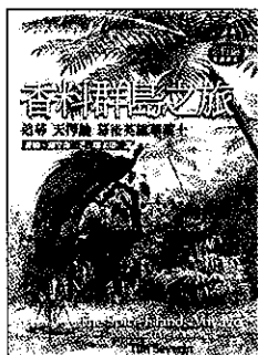
香料群島之旅—追尋「天擇論」幕後英雄華萊士 提姆著；廖素珊譯 馬可李羅/8807