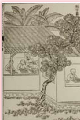
· 《武英殿聚珍版程式》木活字印書工序圖之二刻字圖