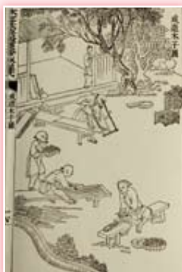
· 《武英殿聚珍版程式》木活字印書工序圖之一成造木子圖