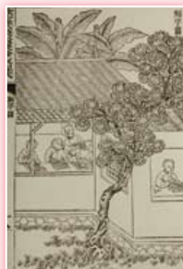
· 《武英殿聚珍版程式》木活字印書工序圖之四槽版圖