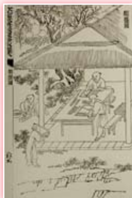
· 《武英殿聚珍版程式》木活字印書工序圖之六類盤圖