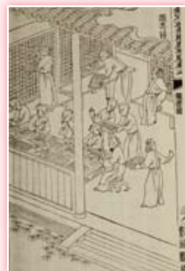
· 《武英殿聚珍版程式》木活字印書工序圖之八擺書圖