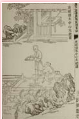
· 《武英殿聚珍版程式》木活字印書工序圖之五夾條頂木中心木總圖