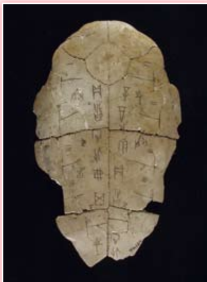
· 甲骨：這是一版對貞卜辭。辛酉這一天，卜問紂正化是否可以戰勝夙方國。「賓」是貞人的名字。（文字及圖片提供／中央研究院歷史語言研究所）

始於蔡倫發明造紙，至七、八世紀之交盛唐時代雕版印刷發明止，以紙來取代笨重的簡冊及昂貴的縑帛，作為寫書的材料。圖書主要作卷軸形，將已寫好的一張張紙粘