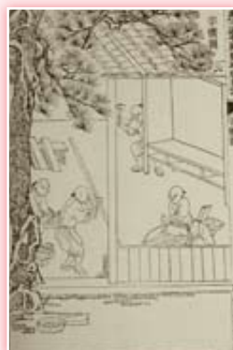
· 《武英殿聚珍版程式》木活字印書工序圖之三字櫃圖