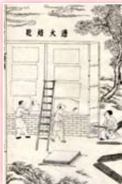
透火焙乾