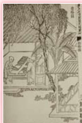
· 《武英殿聚珍版程式》木活字印書工序圖之七套格圖