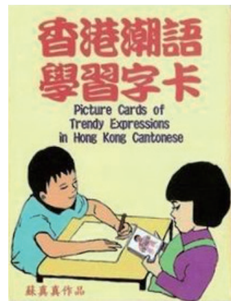
《香港潮語學習字卡》封面

「咖啡書坊」於過去十年迅速崛起，但諷刺是「文青」其中一個重要特徵為拒絕隨波逐流，以突顯自己與眾不同的品味與志向；故此這類店越來越多生客光顧，而漸成主流文化之際，不少原本長期捧場的年輕熟客，反而會嘗試開拓新的聚會地點，形成同類店舖在香港此起彼落地開業、結業，難以長期經營，「Kubrick」的成功算是一個特例。試看本地其他大書商經營「咖啡書坊」的例子：歷史悠久的商務印書館，曾於2014年在水圍「T Town South」開設「咖啡書坊 Bookaccino」，翌年再於沙田「新城市廣場第三期」開設分店，但後者不久前終因商場裝修而被迫結業，至今仍未在同區重開，反映這類店舖不易覓地長時間經營。又如外資書店「葉壹堂 (Page One)」，資本源自新加坡，早於八十年代起在香港開業，高峰時期曾在銅鑼灣「時代廣場」、尖沙咀「海港城」、九龍塘「又一城」等旺區設立門市，人流暢旺，吸引不少讀者流連。其中後兩所分店，更設有提供餐飲服務的「咖啡書坊」；無奈自香港爆發「銅鑼灣書店事件」後，該集團卻突然宣布停售內地敏感的政治書籍，或影響到其生意，最後更於去年底全線結業，反映大集團有時候也敵不過香港天價租金及經濟環境。商務印書館主要賣主流中英文書籍，而葉壹堂昔日則長時間兼售主流與非主流中英文書籍，兩者大體上都以生客及主流讀者為客源，也為香港大書商翹楚。姑勿論兩者定位如何，其資本顯然會比私人經營的小書店雄厚，可是其開設的「咖啡書坊」終究難以長期經營，或