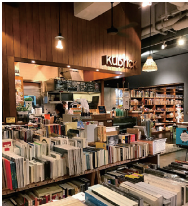
「Kubrick」咖啡書坊一角

許可以看到這類店舖必須有獨特定位及經營策略，方可獲熟客長期支持，才能牢牢地站穩住腳。不難理解，書商如不能及時掌握本地讀者的口味和需要，要在目前艱難的營商環境下生存，確實不是易事。從本地書店生態及閱讀文化看來，規模遠較商務印書館和葉壹堂小的「Kubrick」，不僅兼具「獨立書店」和「咖啡書坊」性質，還建立起自家獨特品牌形象，近期更在中國、臺灣發展業務，獲得空前成功之餘，最重要是穩定地經營下來，實為本地一道奇葩。