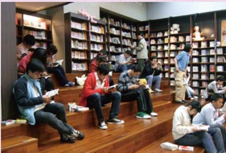
· 民國99年2月23日，漫畫屋開幕，人人手不釋卷，開心閱讀。