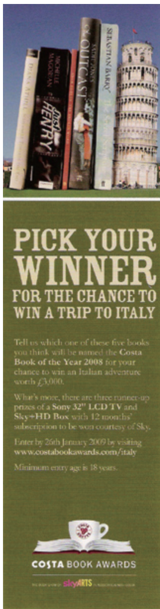
· 科斯塔文學獎邀請讀者票選2008年度之書的海報。

參與討論。各個類別的評選小組獨立作業，在12月初分別圈選四部作品進入各小組的入圍名單，於12月底公布各個類別的得主。當各類得主敲定之後，評選小組就解散了，接下來是組成決選評審團，從各類得主所形成的決選名單中，挑出一部當人文壇的「武林盟主」，也就是本獎的年度代表作大獎。