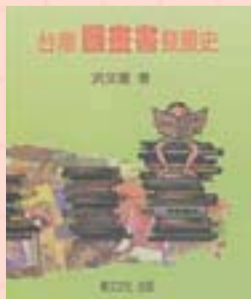
·《台灣圖畫書發展史》封面