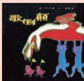
· 《顛倒歌》封面及封底