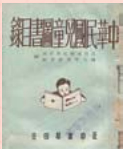
·《中華民國兒童圖書目錄》