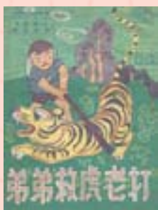
·《打老虎救弟弟》封面