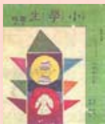
· 《小快樂回家》封面及封底