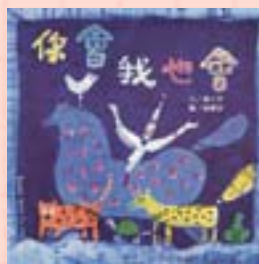
· 《你會我也會》封面及封底