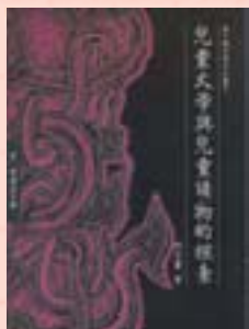
·《兒童文學與兒童讀物的探索》

前者《鳥的生活》，封面標示「連環圖畫」第二輯，可見有未見的第一輯。就內容形式而言，不是「連環圖畫」，卻似知識類圖畫書。後者《亂世孤兒少年時代》，則是「文藝名著圖畫故事叢書」12本中的第10本。就內容形式而言，不是圖畫故事書，而是連環圖畫。二者版式是：7.3x5.2公分。