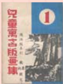
· 《兒童寓言版畫集》（四冊）封面

錄》頁29有：「兒童寓言版畫集（四冊） 魏廉、魏訥著 41.10 臺北市 世界書局」。