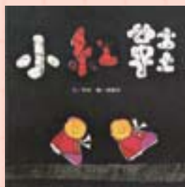
· 《小紅鞋》封面及封底

2006年6月信誼基金會出版社印行《童書任意門》一套：5本圖畫書、一片CD、一本導讀手冊。所謂5本圖畫分別是《小紅鞋》、《你會我也會》、《太平年》、《顛倒歌》、《小蝌蚪找媽媽》。