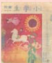
· 《童話裏的王國》封面及封底