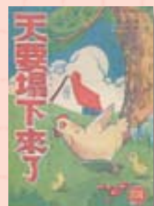
·《天要塌下來了》封面