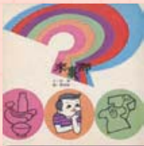
· 中華幼兒叢書《那裏來》封面及封底