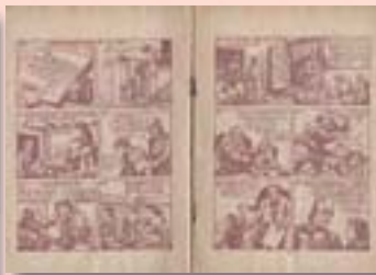
·《亂世孤兒少年時代》封面及內頁

前者《鳥的生活》，封面標示「連環圖畫」第二輯，可見有未見的第一輯。就內容形式而言，不是「連環圖畫」，卻似知識類圖畫書。後者《亂世孤兒少年時代》，則是「文藝名著圖畫故事叢書」12本中的第10本。就內容形式而言，不是圖畫故事書，而是連環圖畫。二者版式是：7.3x5.2公分。