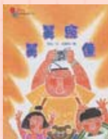
·《舅舅照像》幼翔出版社版