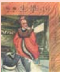
· 《國王和杜鵑》封面及封底