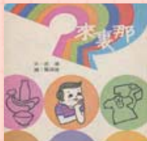
· 中華兒童叢書《那裏來》封面