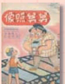
·《舅舅照像》寶島出版社版

林良《舅舅照像》於2000年元月由幼翔文化事業出版社重新出版，洪義男重新繪圖，文字部分則與寶島出版社版完全一致。