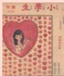
· 《媽媽的畫像》封面及封底