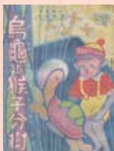
·《烏龜跟猴子分樹》封面