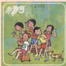
· 《五樣好寶貝》封面及封底