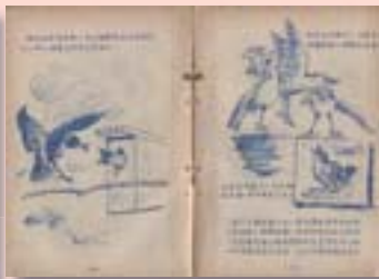
·《鳥的生活》封面及內頁