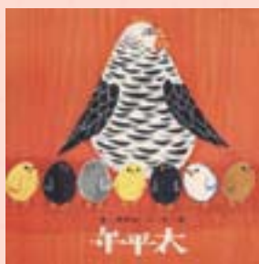
· 《太平年》封面及封底

就現有資料看來，這套書籍確實是11本，他們的出版者是臺灣省政府社會處，而不是教育廳。表4中的編號即是《中華幼兒叢書》本身的編號。其中編號為1的《那裏來》，原是第二期《中華兒童叢書》中的其中一本，編號為11089，出版日期是1971年12月31日，其間差異只是版式不同，又文字有直排與橫排不同。至於《太平年》、《顛倒歌》二本書則標示為《中華兒童叢書》，兩本書的出版時間同為「中華民國59年5月1日」。書的類別是文學類，閱讀對象是一年級，書的編號為11077、11078。其間之所以混淆，或許是由於二者版式相同使然。而這兩本書或可勉強稱之《中華幼兒叢書》前身；因在《中華兒童叢書》中，這兩本的版式很獨特。