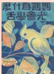
· 《鸚鵡為什麼會學舌》封面

從以上書目中，早於1956年12月者，就有23本之多。而《小水滴》、《小蓮花》標示為「第二集1、2」，可見尚有「第一集」。而書目最後兩本筆者仍未見。