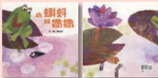
·《小蝌蚪找媽媽》封面及封底

套書外殼標示：「飛回60年代，走進本國自製圖畫書的第一頁。」、「由1960年，一群優良的作家、畫家、美術工作者，投入臺灣最早的幼兒圖畫書系，……」又導讀手冊中說：「從十二本《中華幼兒叢書》中精選五本結集出版。」（頁7）似乎仍有失明察（年代與文本）。