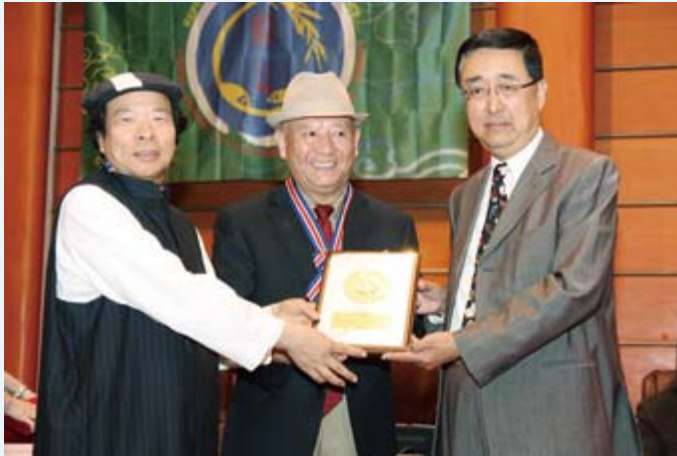
· 顧敏館長（右）與鶴山21世紀國際論壇執行主席愚溪先生（左）共同頒發鶴山文化藝術勳章予中國文聯副主席丹增先生（中）。