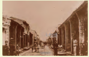
府前街（今重慶南路一段） 1896年

重慶南路 清朝時期 北段稱為府前街 南段稱為文武街 日治時期 北段與南段改為 本町通