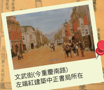
文武街(今重慶南路) 左端紅建築中正書局所在