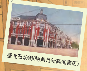
臺北石坊街(轉角是新高堂書店)