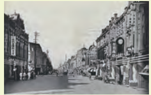
始政四十週年紀念臺灣博覽會 臺北市本町街道