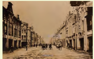
改建後之本町(原府前街 今重慶南路)