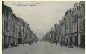
(臺灣臺北)本町街道的盛況