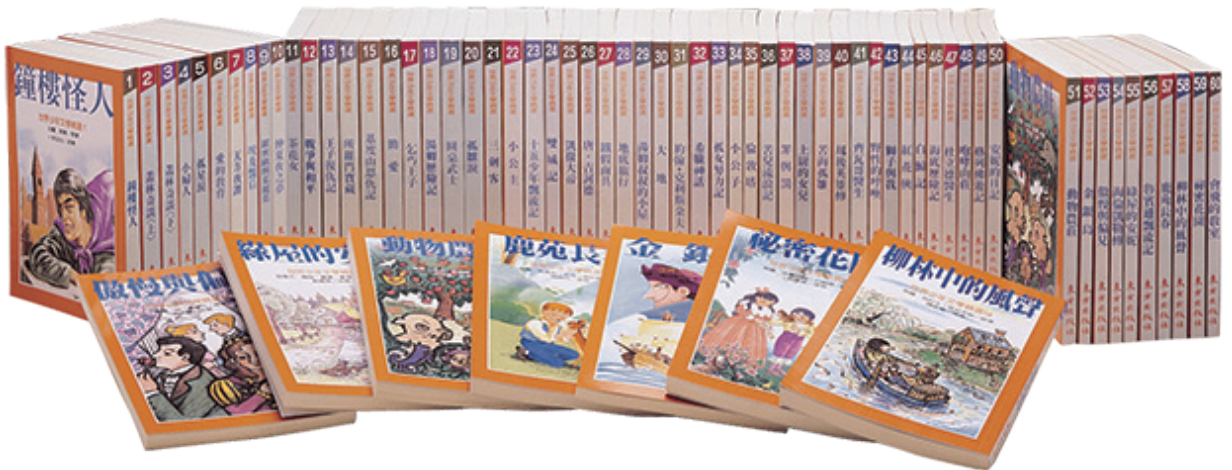
《世界少年文學精選》共有 119 本，2018 年改版為《世界少年文學必讀經典 60》。

該兒童文庫從改編世界名著著手，全部語體文，字字注音，在六〇年代的童書出版是一種「新」的嘗試。此套綜合性文庫設定的適讀對象是國校中高年級學生。