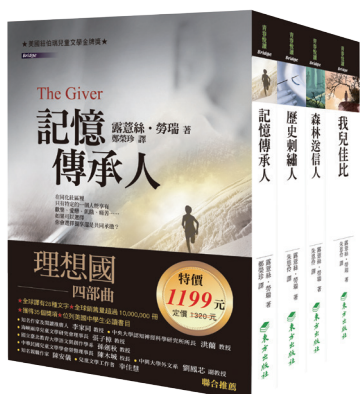
《青春閱讀 Bridge》系列適合國中以上閱讀。 (東方出版社提供)

匯的東方。縱然如此，曾經被視為象徵臺北市文化地標的「書店街」，以及被視為兒童讀物總匯的「東方」，他們耀眼的光芒，相信永遠不會在讀者的閱讀記憶中消逝。