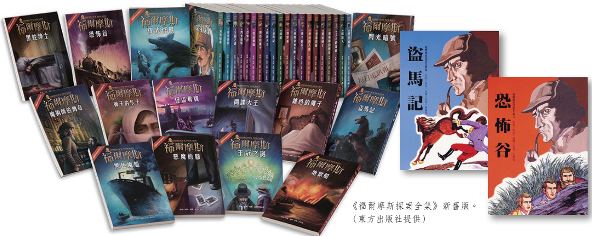
《福爾摩斯探案全集》新舊版。