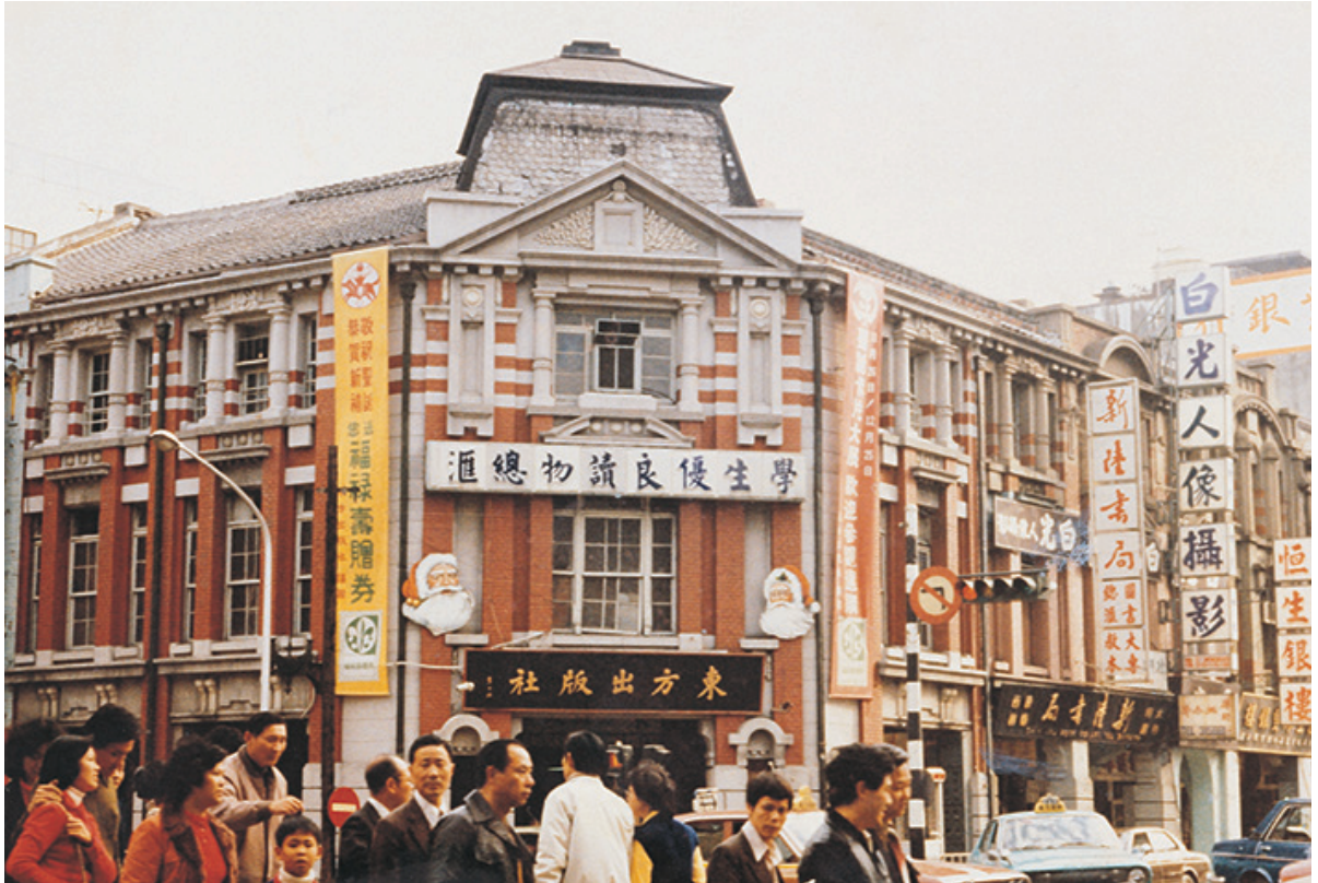
早期位在重慶南路的東方出版社。