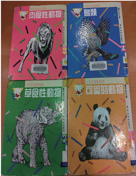
東方出版社 1987 年首次榮獲 行政院新聞局圖書出版金鼎獎的《大家來逛動物園》