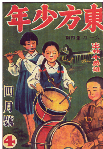
《東方少年》月刊於1954年創刊，以國小及初中生為閱讀對象。

身為戰後臺灣第一家兒童讀物出版社，也是臺北市重慶南路一段書店街最早的書店，七十多年的出版歲月，相信多少會有一些足堪令人懷念、記憶深刻的兒童讀物或是兒童雜誌。