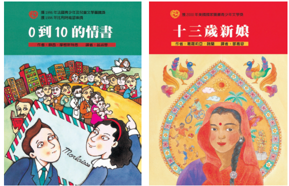
《跨世紀小說精選》適合國小中高年級閱讀。

八〇年代也是一個科技整合的年代，出版社結合學術界做緊密的配合，東方適時搭上這股出版時潮，於 1987 年出版由臺大楊平世老師所著的《大家來逛動物園》，該套書分可愛的動物、草食性動物、肉食性動物、鳥類等四冊，這套經過周密計畫編輯的知識性讀物，榮獲該年度行政院新聞局圖書出版金鼎獎。