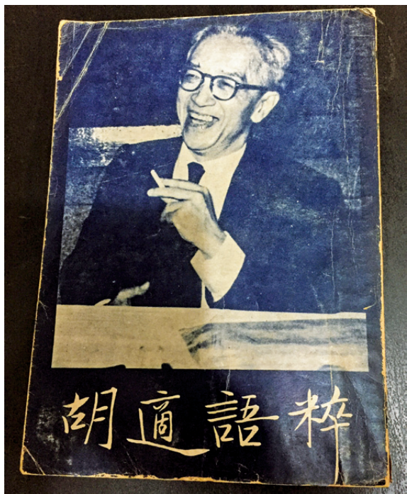
《胡適語粹》益世書局，1975年初版。

這類出版品不只「量」多，「質」也有可觀者，單舉近年兩套「大部頭」為例。一是胡頌平編撰《胡適之先生年譜長編初稿》（聯經 2015 年增補版），精裝十一巨冊，洋洋三百多萬字。此書不論文字長度、資料詳細度都創下史學界既有「年譜」規模。