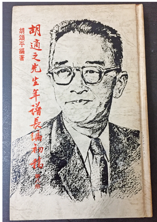
胡頌平編《胡適之先生年譜長篇初稿》，聯經出版。