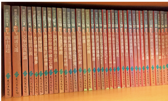
遠流版《胡適作品集》37冊，1986年初版。

也是資料過多，收集不易，一直到胡適去世四十年之後，才見到第一套《胡適全集》44冊，在胡適家鄉「安徽教育出版社」出版。