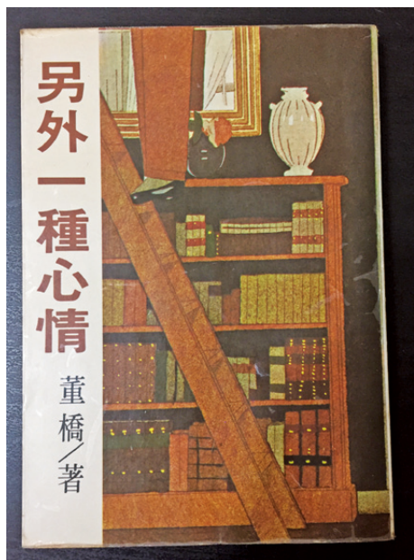
董橋臺灣第一本書《另外一種心情》，1980年遠景初版。

以前出版散文集，大多將某專欄文字收集成冊，或累積一定時間之後，將足量文章集印成書。簡言之，皆是「散篇」文章「集合體」，名