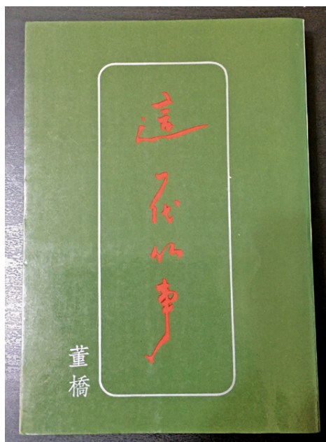
董橋《這一代的事》，1986年圓神初版。