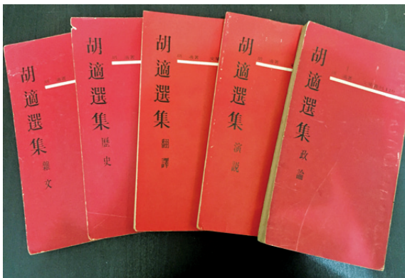
文星版《胡適選集》13冊，1966年初版。