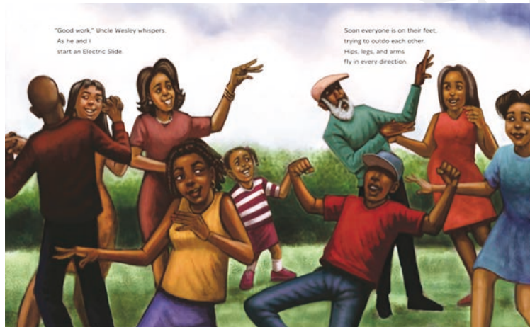
圖片來源：《The Get-Together》，Lonnie Ollivierre 繪，Reycraft 出版社。

而然地熟悉英文的聲音、重音還有抑揚頓挫。在孩子們聆聽歌謠的時候，爸媽能一邊帶著孩子們共舞就更棒了！跟著音樂律動的孩子們除了可以鍛鍊肌肉發展和感覺統合的能力。肢體的律動還能讓孩子抒發情緒和表現自我。跟唱和複述的過程也是很好的培養他們面對英文的記憶。以下提供幾個內容由淺至深的 YouTube 影音平台上全球點播率最高，最有特色的英文歌曲和閱讀相關的頻道，協助重視幼兒英語能力的爸爸媽媽們，能善用不同媒介來讓孩子們培養出學習的興趣。