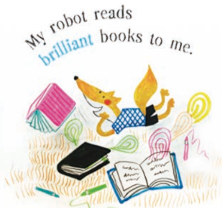
圖片來源：Love on a Plate，Rashin Kheiriyeh 繪，Reyrcraft 出版社。

應的效能，小腦袋瓜自然也會把新單字和熟悉的單字做聯結，這對於他們日後的語言表達能力非常有幫助！