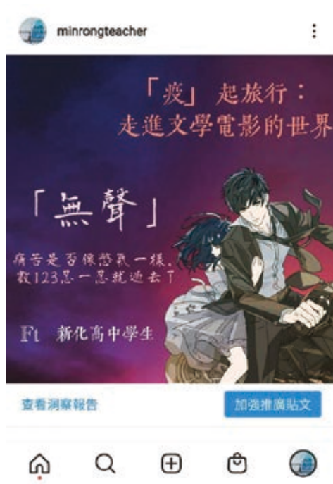
IG 推廣閱讀圖文金句。