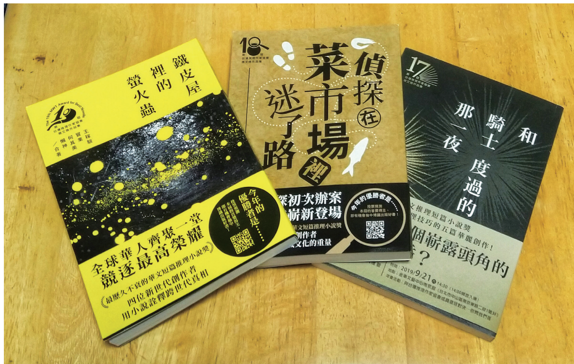
第 17-19 屆台灣推理作家協會徵文獎作品集

新人作家輩出，老作家們也投身推理創作，成績同樣亮眼。軍事、歷史、愛情、美食都能寫得精采的張國立，脫胎自尹清楓命案的《炒飯狙擊手》因主題特殊、文字幽默而受歐美出版社喜愛，授權多國之外近期亦已售出國際影視版權。