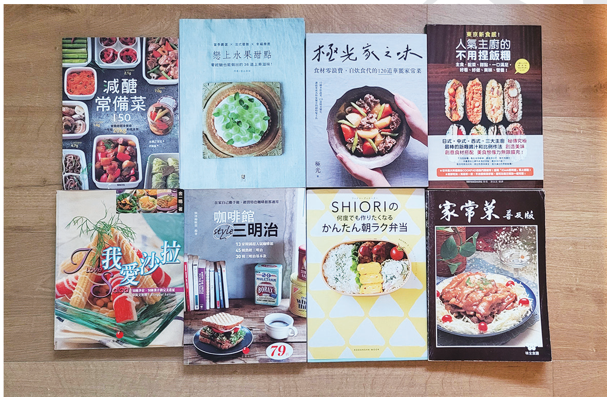
食譜書是關於廚房的未竟夢想

我寶貴的時間。等待生食變熟、調整火候、調整味道，需要耐心。廚房的油煙與高溫，磨損我對嚴苛現實的韌性。最重要的，費盡種種辛苦做出來的一桌菜，終究會消失，因為這就是進食的意義。一旦想到自己努力的成果會消失在這個世界上，我不免陷入虛無。廚房因此成了一個我不愛的地方。