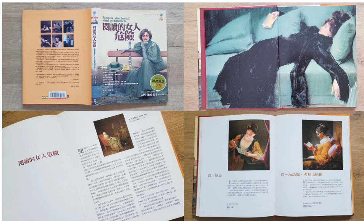
閱讀的女人，擁有不可思議的魅力