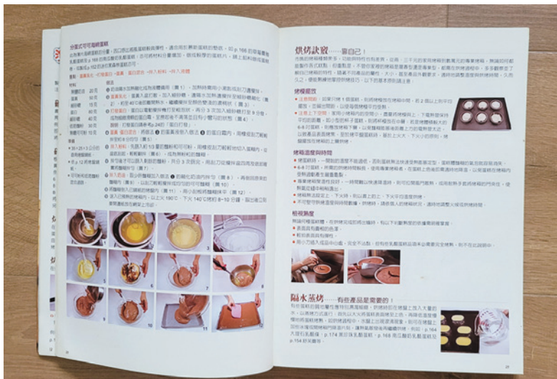
食譜的重點不是美麗的圖片，而是做出餐點的那雙巧手

也許對他來說，生活本身就是人生的舞臺，而不只是後臺。把生活當舞臺的人，他的生活就是創作。而像我這種把生活當作後臺的人，意味著我在前臺有更在意的事，例如工作或者其他