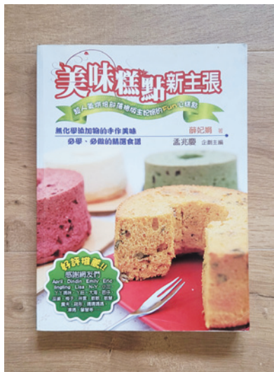
家裡的青少年兒子接手了這個「好好生活」的夢想