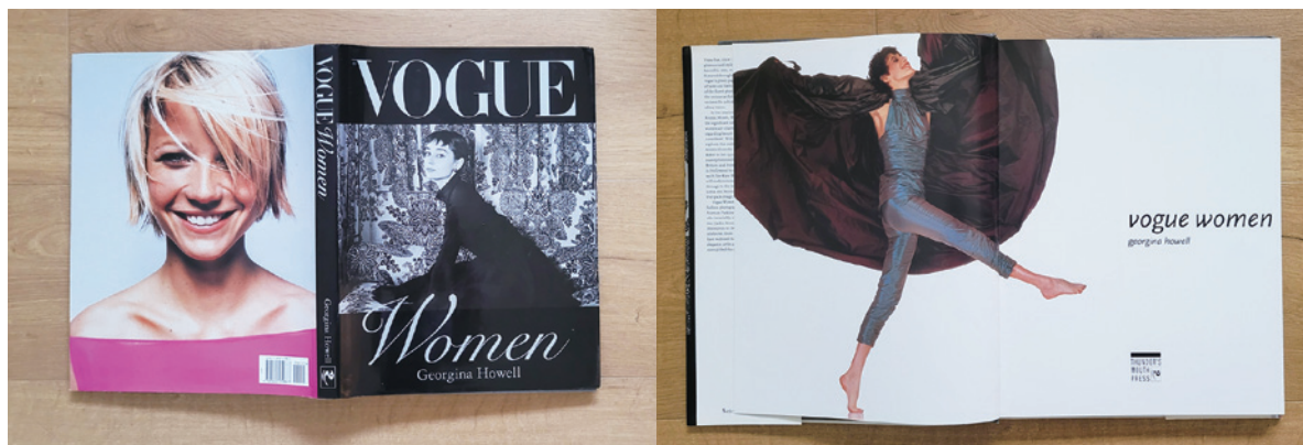
從朋友書架上借來的美麗，在我的現實中顯得虛幻

別人家裡偷來、藏在地下室的芭比娃娃）。仔細翻閱之後，我發現這兩本書有一個共通點：書裡的女性看起來是如此美麗而受到祝福。