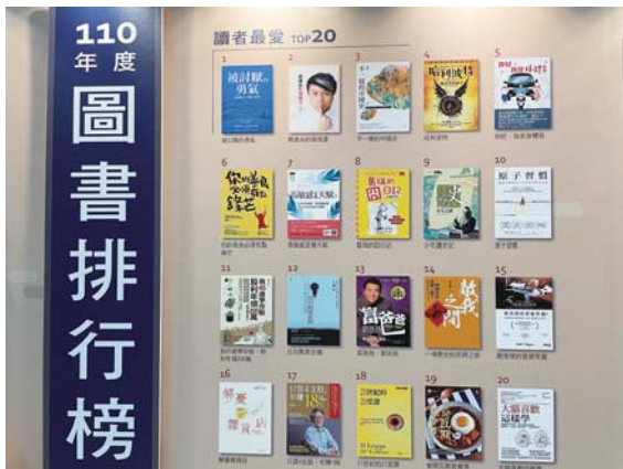
國家圖書館藝文中心展示的圖書排行榜