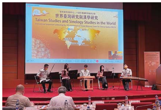
「世界臺灣研究與漢學研究」於國家圖書館舉辦