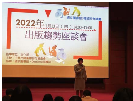
曾館長主持「2022年出版趨勢座談會」

遊戲去帶入主題，讓文獻展充滿知性與趣味；去年（2022年）冬季閱讀講座：西方女作家的多重宇宙系列講座等，每年舉辦「出版趨勢座談會」，如「出版的未來——後疫情時代，如何校準書與讀者之間的距離」，也有當年度票選借閱長勝軍的書單展示，2022年所舉辦世界臺灣研究與漢學研究，我都有參與其中，真的由衷感謝國家圖書館策劃了許多好的主題與活動，讓我們能掌握專業領域趨勢與閱讀的脈動。