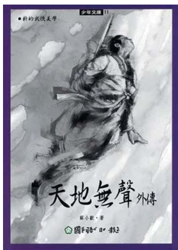
蘇小歡著。《天地無聲》，臺北市：國語日報社，2002。

而2016年，一本由兒童文學作家廖炳焜書寫的《來自古井的小神童》（巴巴文化）則有所