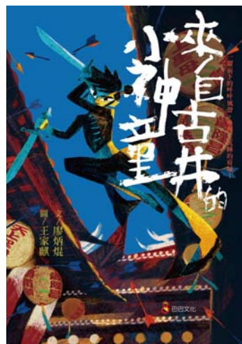
廖炳焜著；王嘉麒圖。《來自古井的小神童》，臺北市：巴巴文化，2022。