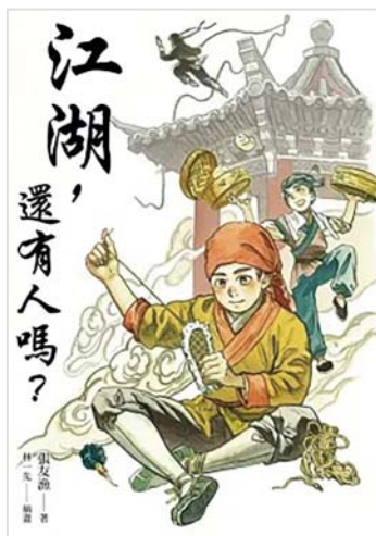
張友漁著；林一先圖。《江湖，還有人嗎？》，臺北市：遠流，2019。

由廖炳焜撰寫的《來自古井的小神童》，揉合臺南府城歷史和傳說，以29個章回，架構長篇兒童武俠。每個章回篇幅短，情節環環相扣，