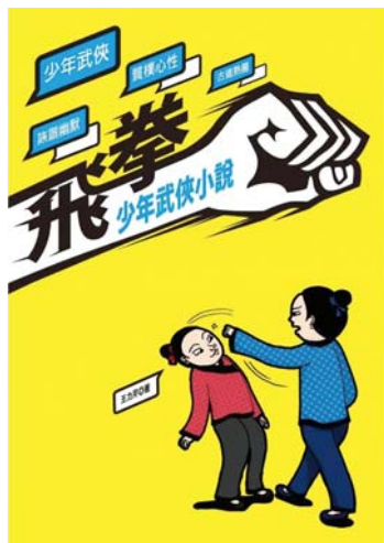
王力芹著。《飛拳——少年武俠小說》，臺北市：秀威少年，2013。