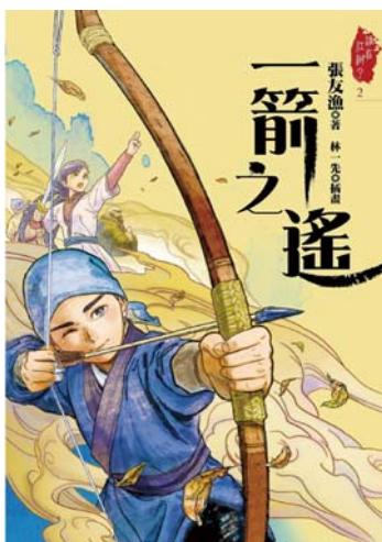
張友漁著；林一先圖。《一箭之遙》，臺北市：遠流，2022。