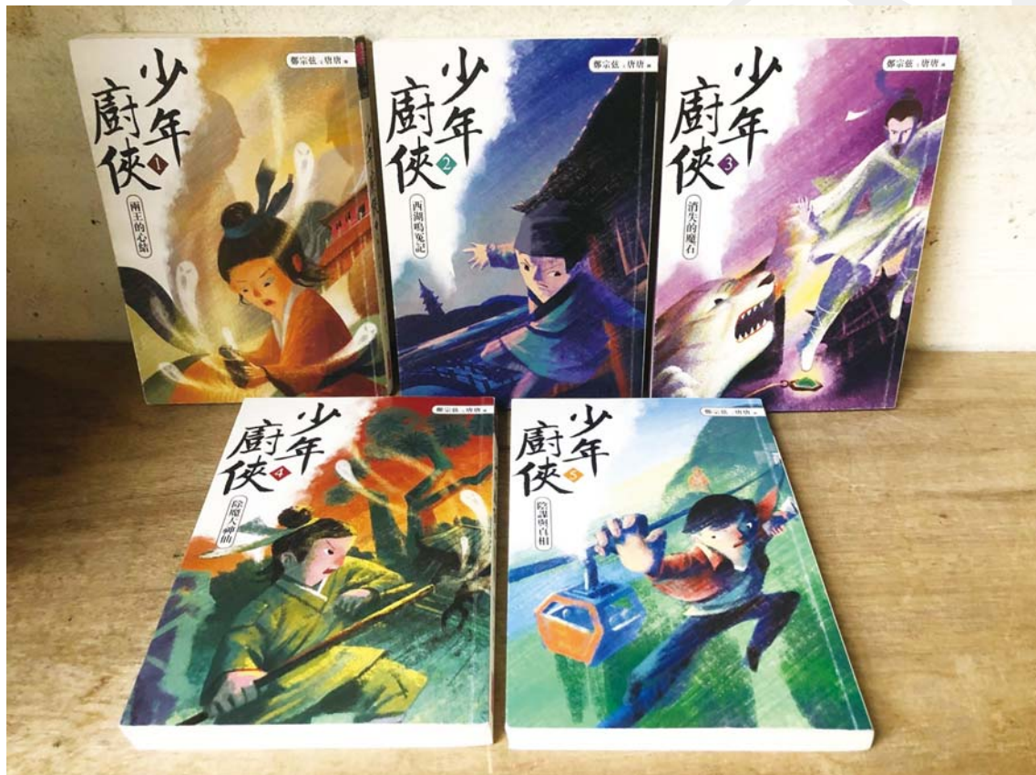
鄭宗弦著；唐唐圖。《少年廚俠》(系列五冊)，臺北市：親子天下，2020。