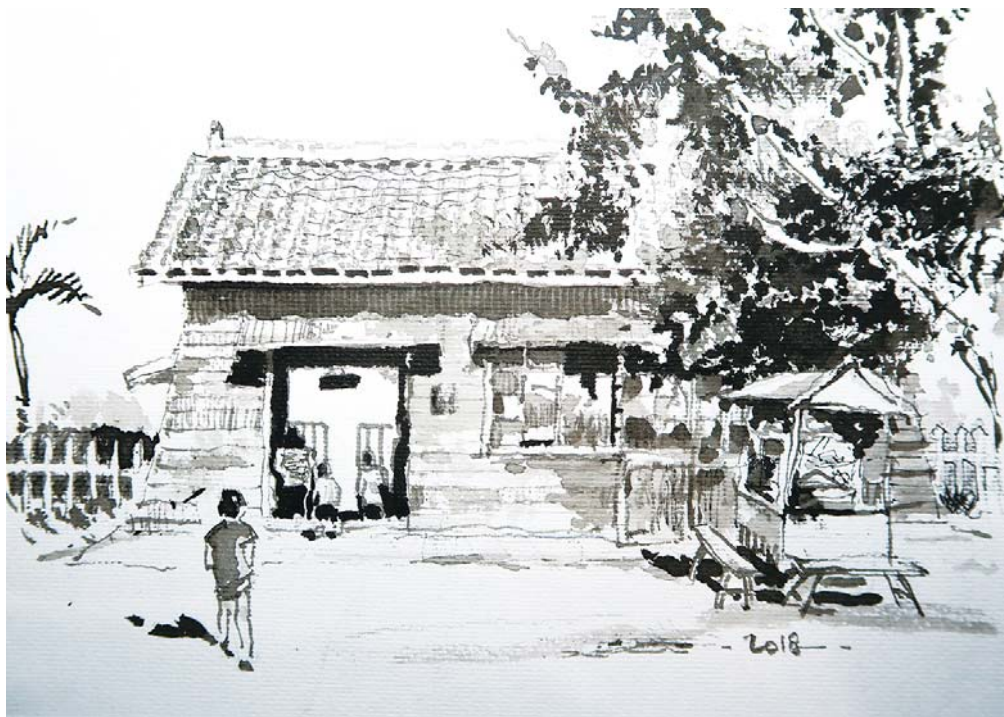
只能在夢中回味的林榮火車站（林十一郎繪製）

2019年鳳林鎮蕭文龍鎮長送來一輛報廢的自強號客車廂，擺在火車紀念公園木倉庫前，此舉讓心靈久已乾涸的林榮里民重沃生機。因村子