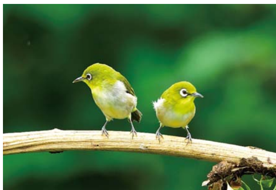
林榮國小有多棵櫻花樹，在櫻花盛開時總是吸引成群的綠繡眼來覓食。