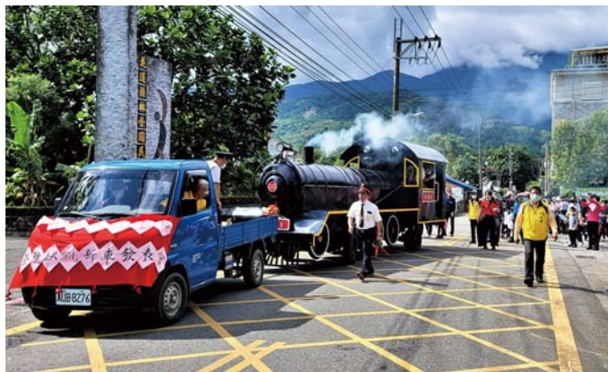
「林榮號 LDK 001」新車發表會後的遊行路線比照媽祖繞境的路線