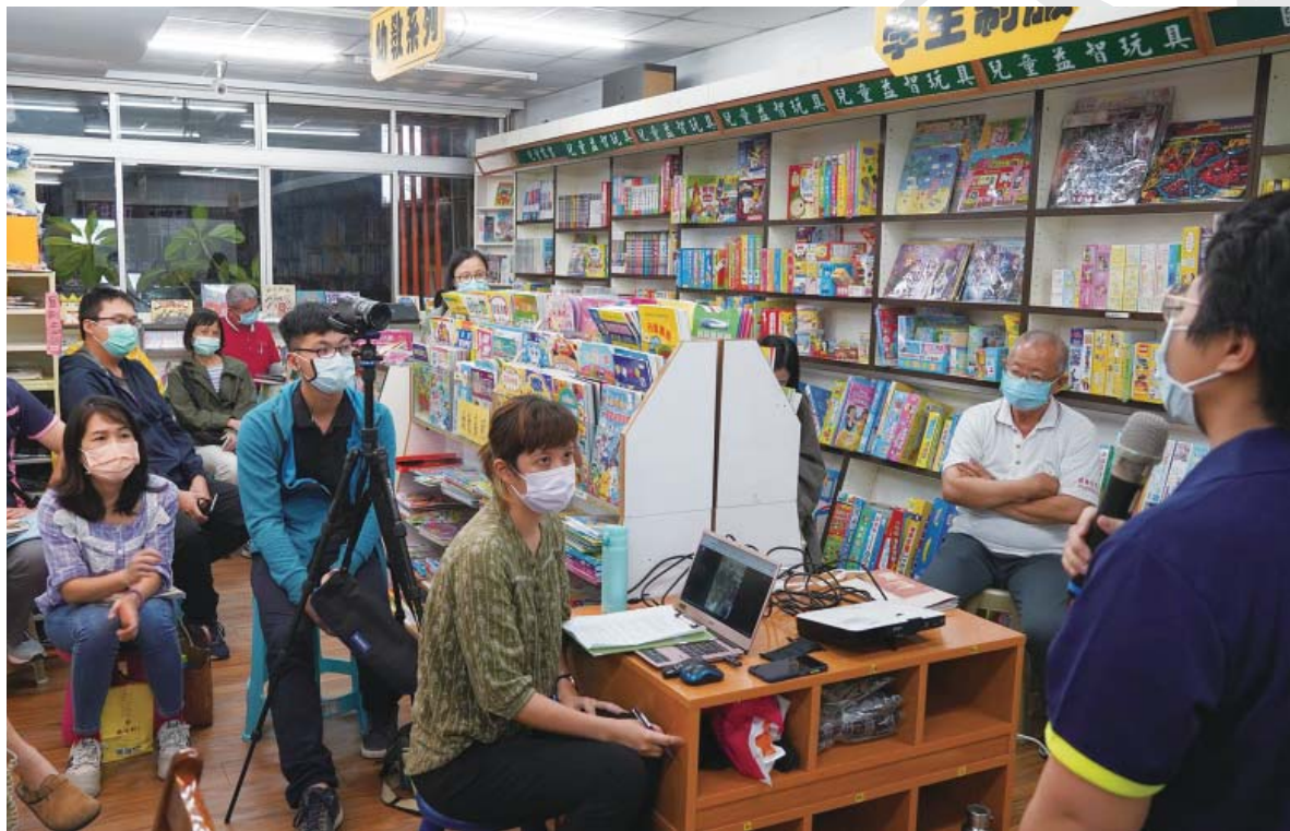
「小農女的田野日誌」的實況

也笑著說，其實不管是生活還是人際，都要靠自己自我調適，與其想著改變別人，不如改變自己，不要過度自我責怪，把該做的事情做好，盡量拓展自己的生活圈與交友圈。現在，她們已經可以認同民雄是她們的家。