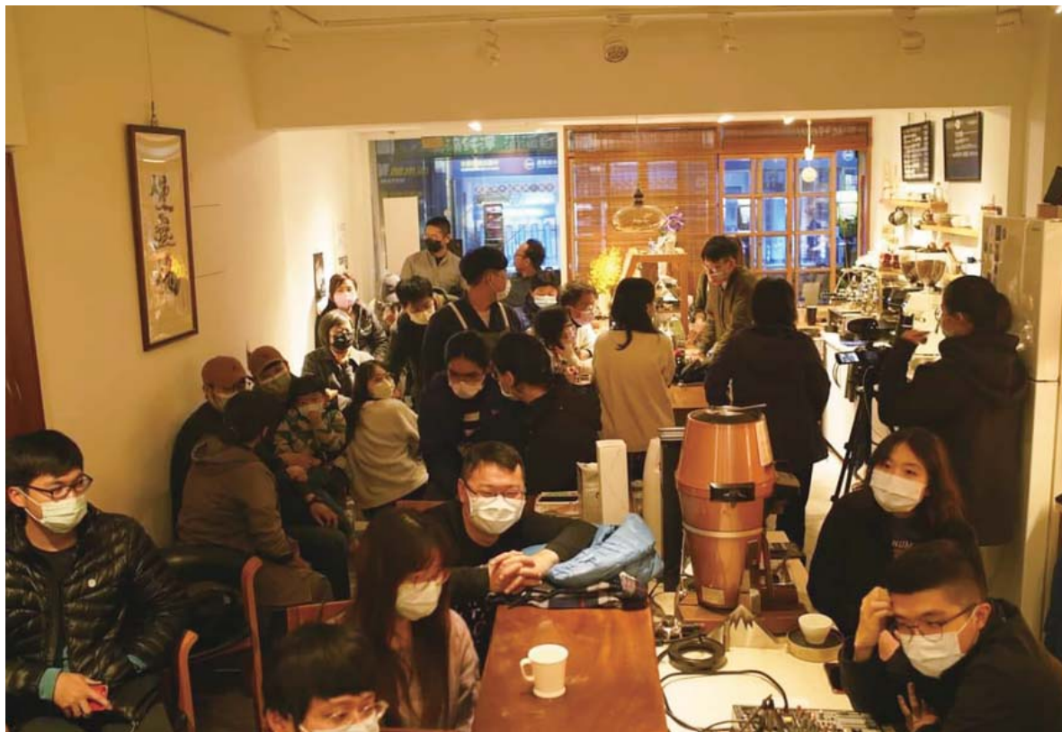
烈風講堂活動現場概況

專長，彼此分工、共同學習，在協力規劃、共同辦理的過程中，彼此分享經驗與方法、思考方式，也累積經驗，未來社區辦理類似活動，不受限於計畫團隊的介入或主導；最後，我們期待把知識追求、公共討論常態化，活動舉辦的地點選在社區咖啡館、獨立書店及文史空間，讓地方有更多社區討論的行動節點。