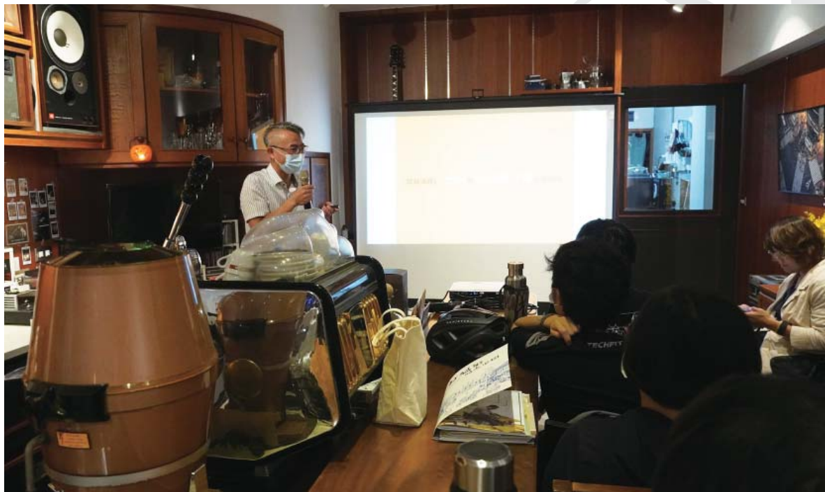
何科長分享公務機關與公民參與議題

就是按照規範、安全標準去做事，沒想到 2018 年的護樹運動看到鄉民的不同意見，也開始思考公民參與的問題，雖然工程延宕了近兩年，但卻是另一種啟發。