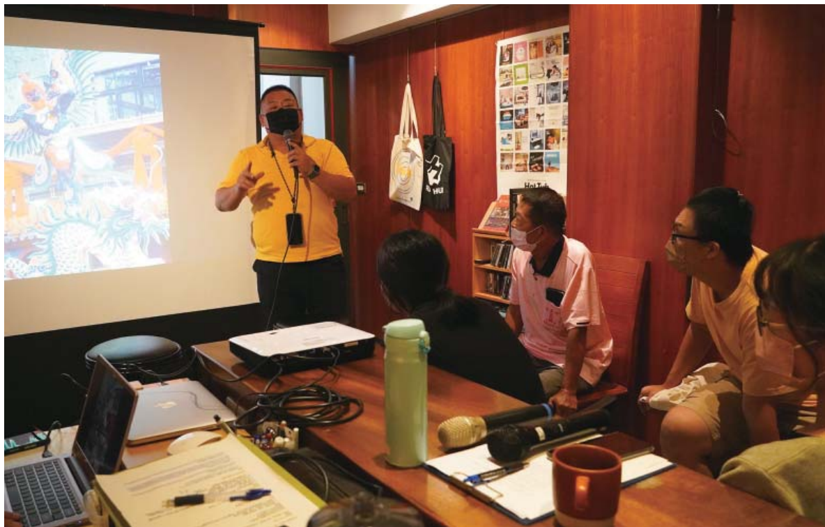
「祭技一堂——祭典外的技藝場」的實況

工業區，民雄早已是「農工大鄉」。民雄也是鄰近嘉義市的重要城鎮，有省道、鐵路通過，商業發達，曾經也有彈藥庫、軍營，再加上境內及隔壁的大林鎮共有四所大學，是嘉義縣的繁華之地，在不同階段吸引了來自各地的新移民。