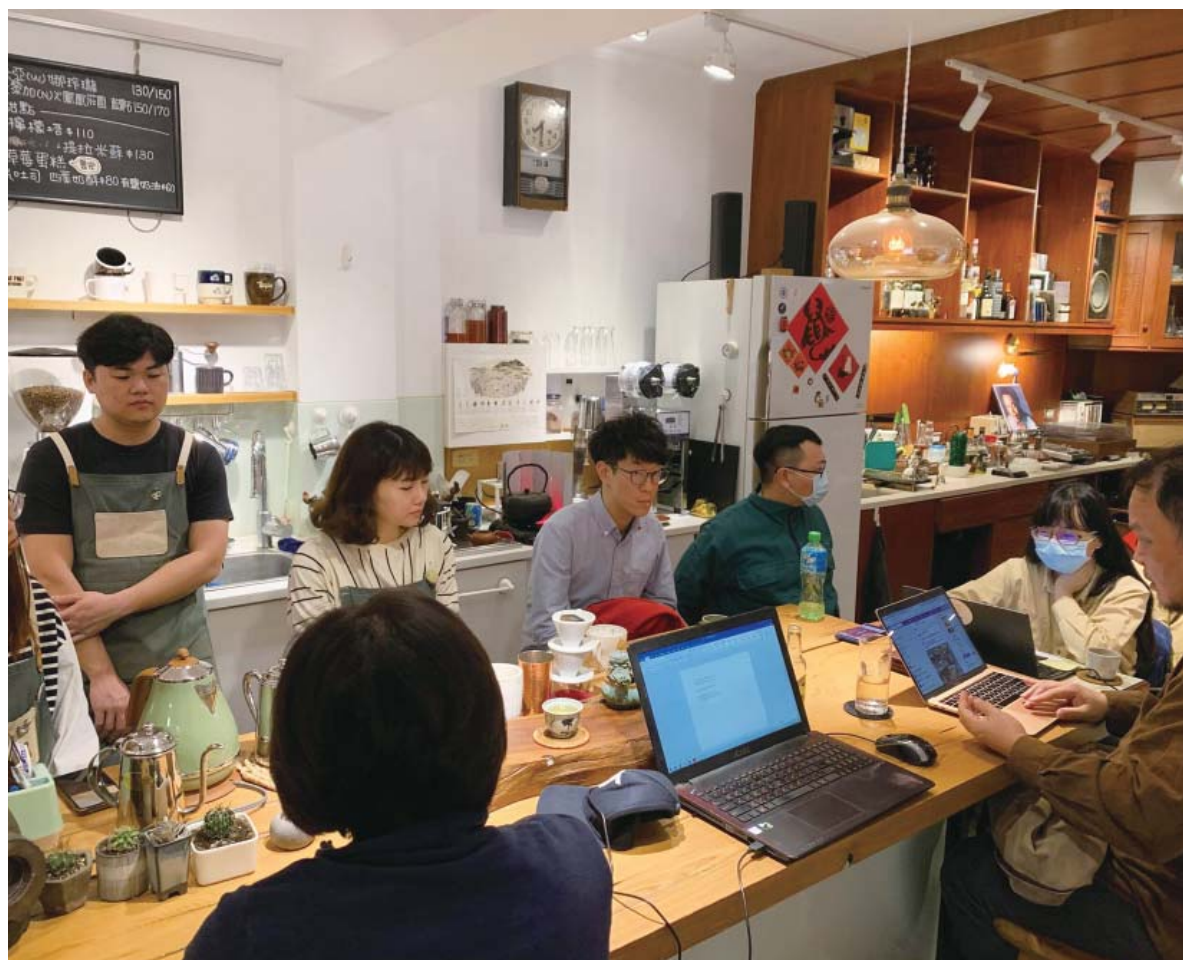
重構大學路團隊和鄉民規劃討論

雖然重構大學路計畫未獲教育部USR的補助，難有經費支持「烈風講堂」的常態舉辦，還好我們成立了「打貓街坊文化協會」，不僅轉由在地組織支持經費，並由鄉民接力繼續奔向下一個階段，期待在地知識與鄉民力量能夠在鄉民與大學師生的共同努力下傳承與前進。