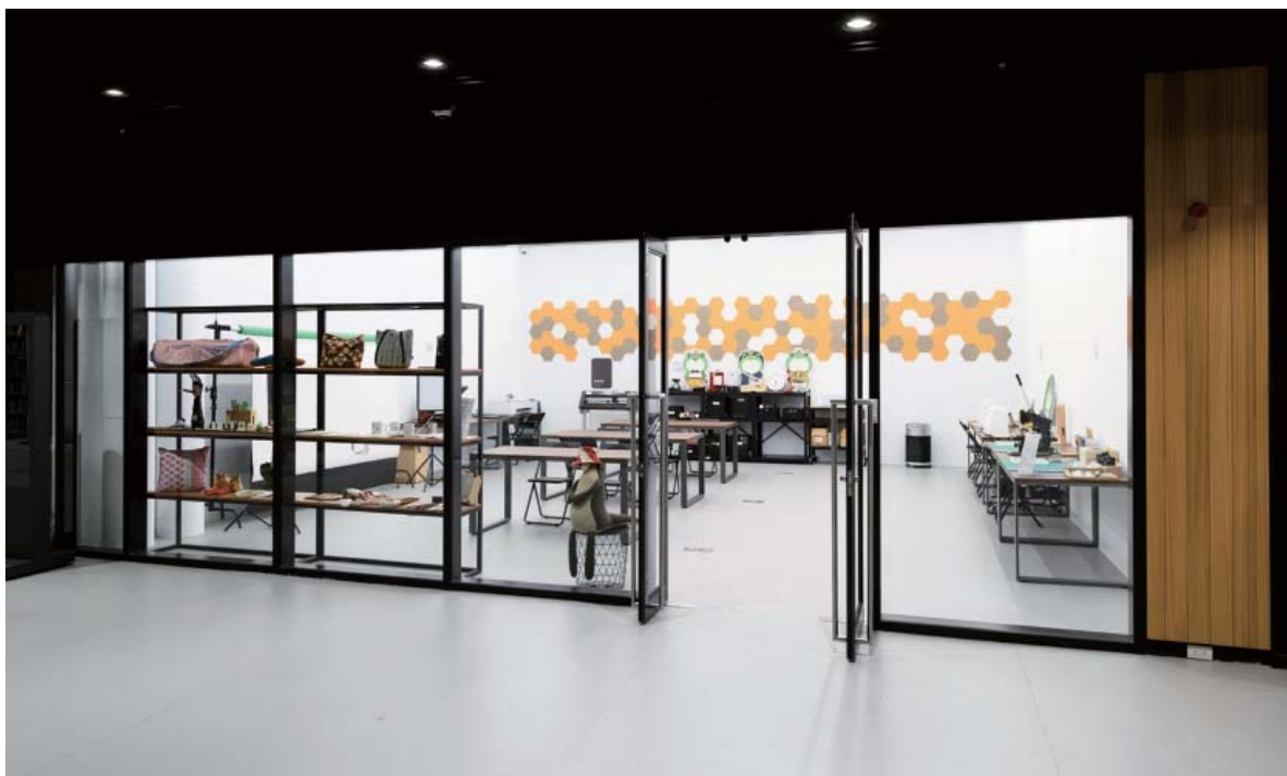
創客空間—設置 3D 列印區、熱轉印區、縫紉區、皮革區、攝影區及作品櫥窗

南市圖新總館設立之初，即納入「創客空間」規劃，設置 3D 列印區、熱轉印區、縫紉區、皮革區、攝影區及作品櫥窗，再透過舉辦各種活動及設備借用服務，邀請民眾玩轉生活。這裡每月推出 2 至 3 場各類課程，課程規劃以設備特性為主，適時結合節慶等主題，例如：3D 列印做名牌、熱轉印馬克杯及小方巾、端午節電繡小香