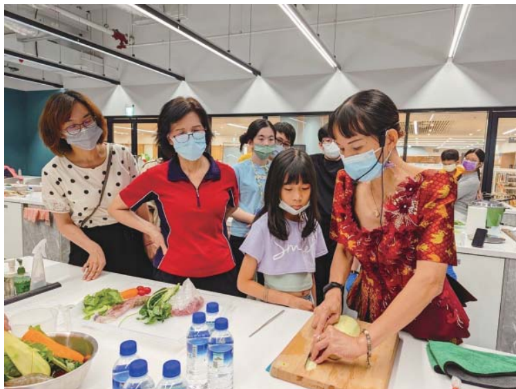
城市灶咖邀請柬埔寨講師帶來涼拌青木瓜料理