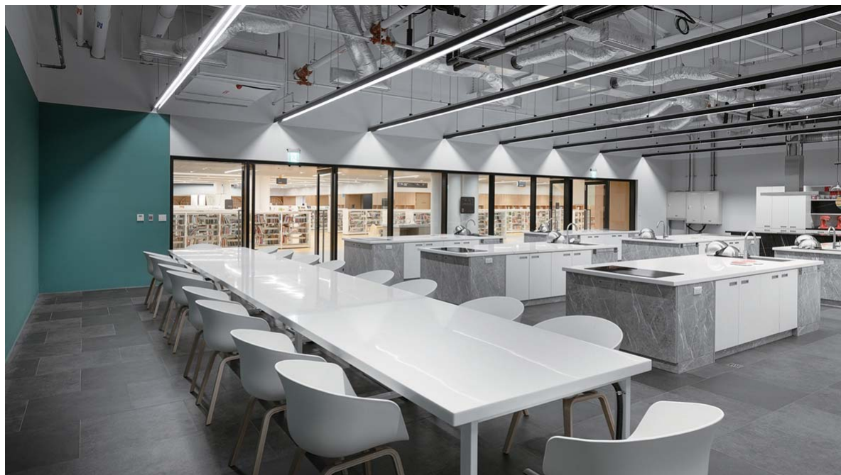
城市灶咖設有中島等廚房設備

面對推陳出新的圖書館，南市圖如何成為最有記憶點的圖書館呢？具有 400 年歷史的臺南府城，豐富的文化底蘊可不是浪得虛名。美食的起源在「灶咖」，臺南美食眾所皆知，臺南人懂吃、