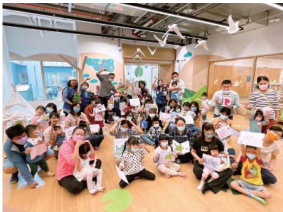
五感探索區定期舉辦小小探險家闖關活動