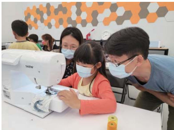
創客空間—親子一同縫縫補補樂趣多