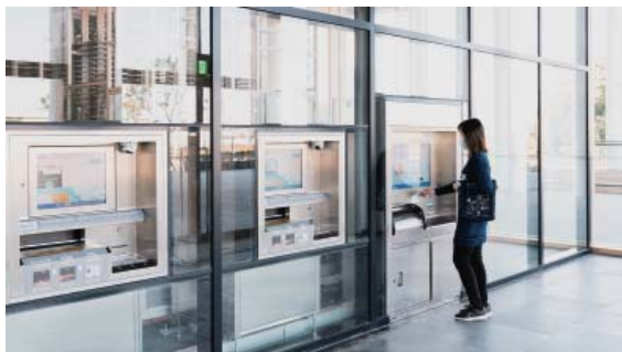
24 小時自助取還書站

明亮的空間，豐富多元的設施設備，讓許多初次到訪的民眾不禁說出：從沒見過這樣的圖書館！