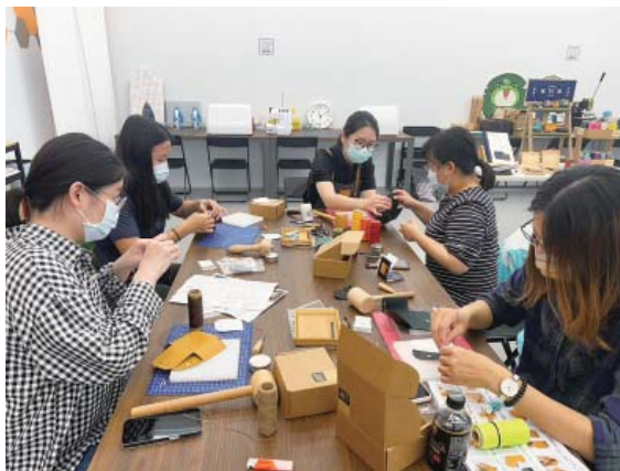
創客空間—製作皮革零錢包