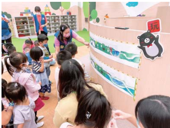
五感探索區—小小探險家闖關中

具外，還有爸媽及小朋友都最愛的放電空間漫讀廣場，其中，最受歡迎的莫屬「五感探索區」。限定 0 到 5 歲孩子專屬，培養閱讀早期素養的「說、唱、讀、寫、玩」能力，入口處由臺南永康三崁店的諸羅樹蛙帶領，踏上地面荷葉點亮照明，就此展開一場閱讀歷險記。