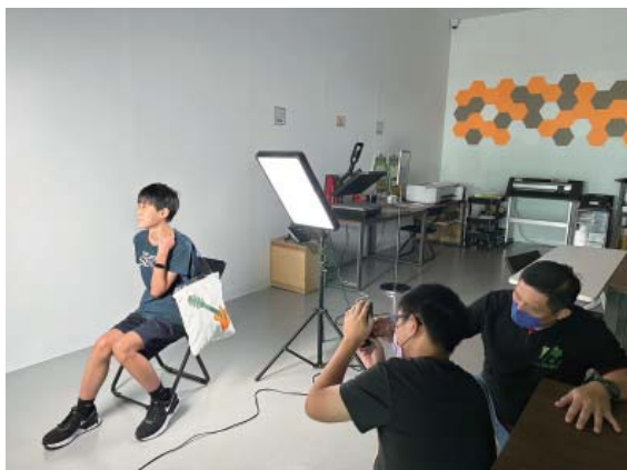
創客空間—青少年暑期創客研習班學習攝影技巧