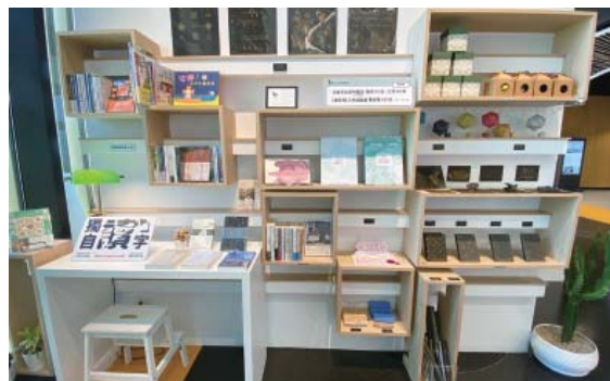
烏邦書店—文創商品寄賣