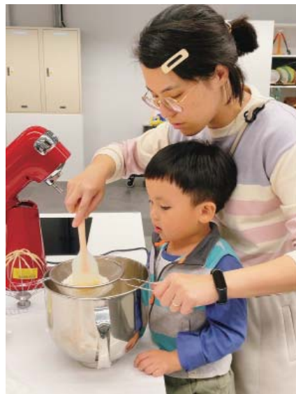
城市灶咖一家長帶著孩子製作美味點心

愛吃、總有幾家不太想與觀光客分享的美味店家名單，那麼，在臺南的圖書館裡出現一間灶咖，可能也不算太意外？我們就這樣大膽地把「城市灶咖」放進圖書館裡了！灶咖裡有 7 座設備齊全的料理中島，包含 IH 爐、流理臺、烤箱、攪拌機及各類鍋盤廚具等，最多可進行 36 人課程；大長桌及電視可作為講師授課、分享及學員討論與享用餐點的空間。鄰近書櫃設置「美食圖書」專區，典藏各類美食與文學相關的圖書，一旁還搬來《俗女養成記 2》嘉玲家的中島，邀請民眾不僅學習做料理，也能取下一本美食好書，悠閒地坐在中島細細品嚐，徜徉在美食與文學匯流的奇妙世界。