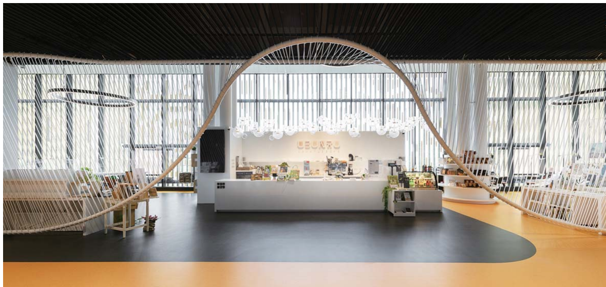
烏邦書店空間設計融入圖書館建築特色