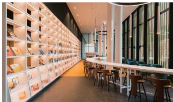
烏邦書店—內部空間

此，圖書館與書店間有許多合作，包括圖書館文創小物獨家寄賣、配合圖書館活動於現場販售圖書，或由書店搭配圖書館活動及展覽，適時將「應景」的書放在店內最醒目的位置，一同宣傳圖書館活動，透過良好的合作關係，共同帶給讀者豐富的閱讀體驗。