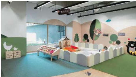
五感探索區—0-2 歲嬰幼兒專屬寶貝森林