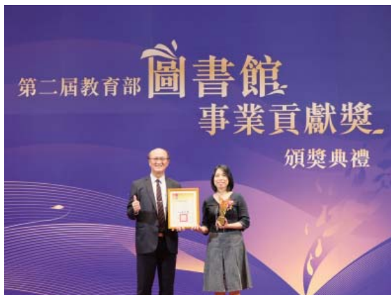
南市圖榮獲教育部第二屆圖書館事業貢獻獎一標竿圖書館

動，可由讀者與自身經歷交融詮釋，更因為人們的分享而激盪出更多想法。曾聽起鮮少使用圖書館的朋友說起：「這麼多的書，實在不知道該如何找到感興趣的書。」圖書館以傳播知識為首要任務，在知識海洋中，也為讀者掌舵、領航，引進豐富的資訊，也精選好知識推薦給讀者。我們積極地結合各種資源，把想像變成真實、不可能成為可能，透過打造特色場域及多元閱讀活動，邀請民眾身歷其境，挖掘未曾發現的圖書館新鮮事，製造書本主動與讀者對話的機會。新總館營運至今已邁入第4個年頭，2023年底，更榮獲「教育部第二屆圖書館事業貢獻獎一標竿圖書館」的殊榮，感謝教育部肯定這群一路不畏辛苦的圖書館員，感謝廣大讀者的愛護，攜手締造令人耳目一新的圖書館風貌。未來我們也將持續朝著開創生活休閒、數位學習、圖書資訊、研究資訊及文化資源中心而努力！