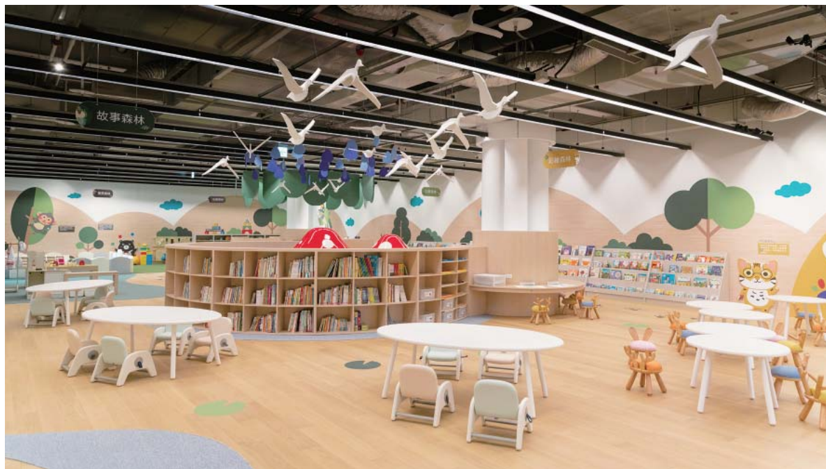
五感探索區—「說、唱、讀、寫、玩」空間分明

南市圖新總館將 B1F 設置為兒童專屬空間，除了各類兒童圖書、立體書、視聽資料、桌遊教