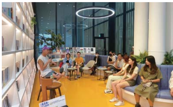
烏邦書店—作家講座

此，圖書館與書店間有許多合作，包括圖書館文創小物獨家寄賣、配合圖書館活動於現場販售圖書，或由書店搭配圖書館活動及展覽，適時將「應景」的書放在店內最醒目的位置，一同宣傳圖書館活動，透過良好的合作關係，共同帶給讀者豐富的閱讀體驗。