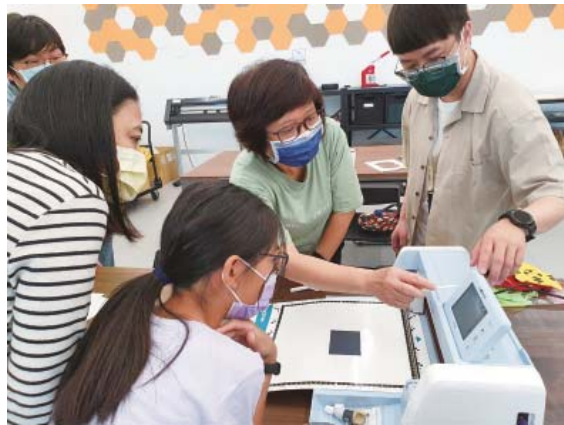
創客空間辦理多樣課程邀請民眾玩轉生活

過去，圖書館是以「書」為本的時代，今日則強調以「人」為本，閱讀建立在書本與人的互