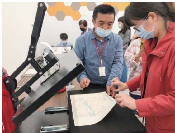
創客空間—民眾將自己的創作進行熱轉印