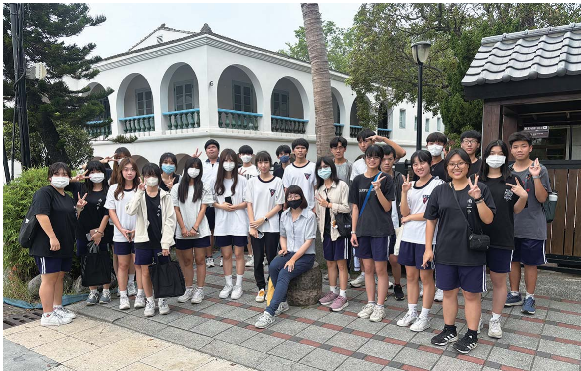
帶領學生從共讀出發，開啟在地旅行，實際踏查府城安平樹屋，並感受《海風書店》中提及的自然環境氛圍

整體來說，以Podcast 模式帶領共讀，可以培養學生「以閱讀創造聲音，以聲音轉化閱讀」，在相輔相成之中，開拓觀看書籍的視角，在理性地審視與感性的暈染下，譜出屬於自己獨特而鏗鏘的閱讀節奏。