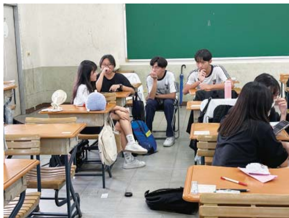
學生分組討論《海風書店》的章節重點，並設計腳本

第三，在閱讀中帶入「聲情的力量」，並修改出更具情感深度的 Podcast 節目腳本。聲音與閱讀息息相關，透過「聽、說」的引導與激盪，開拓了「讀、寫」不一樣的視角，可以更深入展現書中角色的性格與情節推展，進而呈現其中的內在衝突與兩難，藉由聲音表情的設計與聆聽，可以讓學生在聲情的揣摩中，更進一步以同理心的角度出發，深入書中角色與作者寓意，達到真