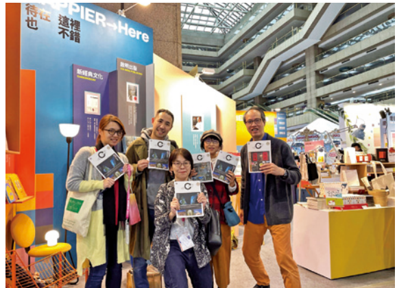
《新北市文化》季刊編輯團隊，2024 年在台北國際書展合照。

符合這樣設定的城市生活雜誌，應該就是這本封面印著一個大 C 英文字母的新北市文化季刊。