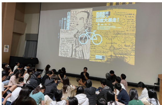
學生席地而坐，專注聆聽演講。