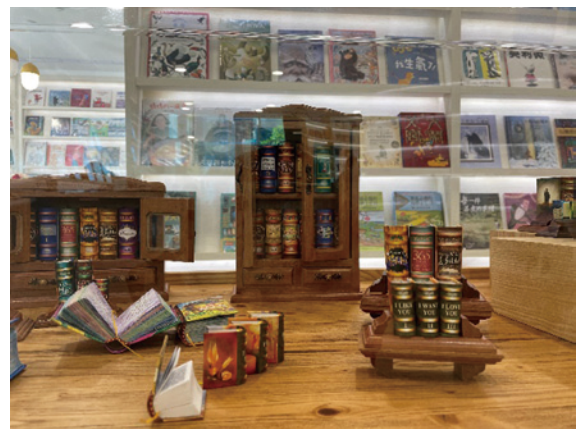
益品書屋的精裝豆本裝幀書展示