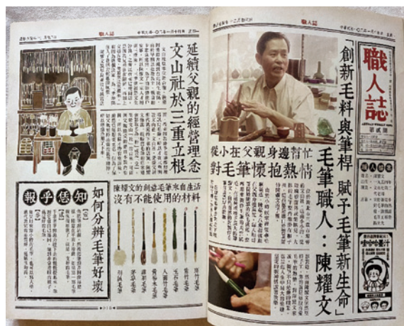
《職人誌：52 個頂真職人認真打拚的故事》