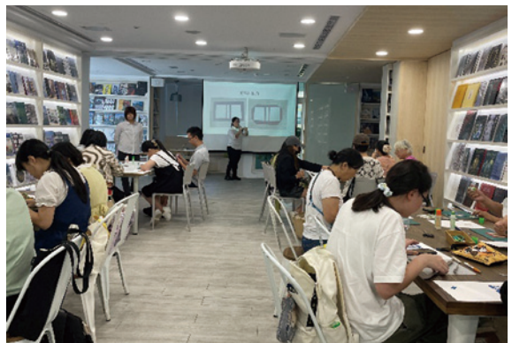
淡水益品書屋豆本裝幀工作坊現場

參與者跟著講師一步一步實作，體驗書籍誕生的完整過程，閱讀不再只是眼睛的活動，而是雙手與心靈的參與。