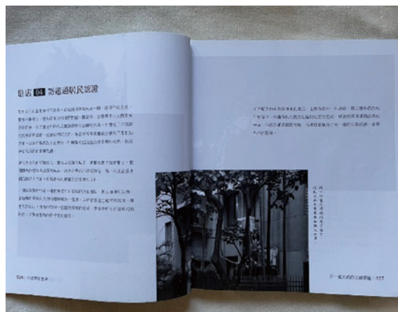
《有意思的巷弄：臺北民生社區》