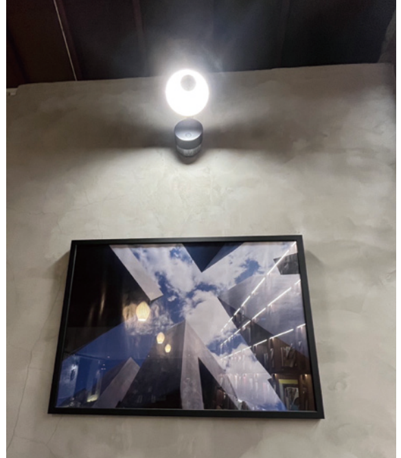
店內牆上懸掛之猶太人紀念碑海報

2023 年享讀福爾摩沙開始以「閱讀的 100 種樣子」為題，在臺中柳川與自立街口（近臺中文學公園）展開「柳川日和書市集」吸引聚集愛書人參與活動，形成一種臺中文化閱讀嘉年華。