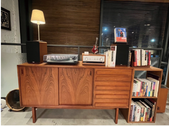
店內角落的黑膠唱盤機

在黑膠唱盤的正對面牆上，掛著一張攝影作品，它是一張柏林布蘭登堡南邊的歐洲被害猶太人紀念碑海報，那是一個充滿悲傷回憶、象徵著痛苦歷史的地方，讓世人記著一群人曾經對另外一群人做過怎樣的暴行。碑體灰色的柱狀跟上方的一小片天空，或許就是猶太人們當初被迫害的感受，求助無門、看得見天空卻觸摸不到自由，那是失去人權的無助感。