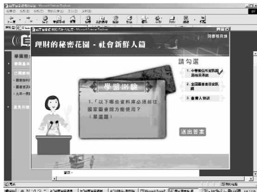
▲ 圖四：自我學習測驗畫面