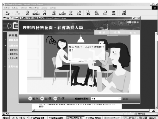
▲ 圖三：影音課程畫面

本文主要參考國家圖書館遠距學園課程「國家圖書館網路資源—財經篇」。「遠距學園」網址： http://cu.ncl.edu.tw/ 。「國家圖書館網路資源—財經篇」課程網址： http://cu.ncl.edu.tw/1000110138/clas/index.htm 。