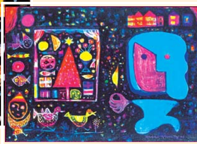
▲〈賣火柴的女孩〉內頁圖

現寒冷中的小女孩，採用寒冷的色調作為整個人形的基調，女孩的臉上有局部的紅，那是因為她劃了火柴所發出的一點點光芒的溫暖，在畫作的另一邊則表現出小女孩渴望的平安夜的美景！