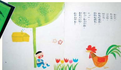
▲《我要大公雞》內頁圖

由編輯小組提供的國外圖畫書，發現國外兒童書籍製作十分精美，表現手法多樣化，真是大開眼界。相較於當時，臺灣的兒童讀物不僅插圖很缺乏，在人物造型上或是文字表現上也十分刻板。