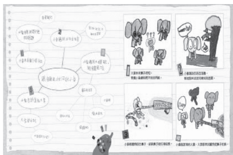
◆ 這是一位國小三年級的小朋友依據繪本故事《跟鱷魚拔河的小象》（東西圖書出版）繪製的故事網路圖和四格漫畫。

最後本系列以「翻翻書」的形式拍版定案，每本書包含十五個經典故事，每個故事分成四大段落，每一段落分別代表：人物、問題、解決方法、結局；縱向學習可以看到十五個故事的四個段落均可互相串連、攪拌，讓孩子可以自創不同過程與結局的「另類童話」；且各段落皆以不同的修辭文句來敘述故事，因此橫向學習可以學到四種類型的修辭方法。