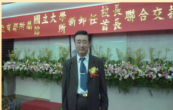
· 國家圖書館第十二任館長 顧敏館長