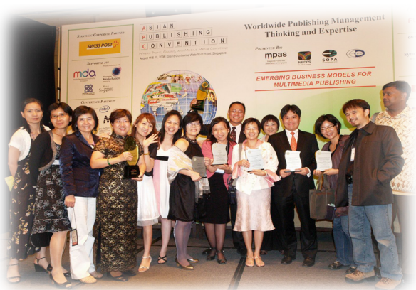
· 2008年8月15日，臺灣代表團於亞洲出版大獎奪得7項大獎的殊榮，團員開心合照。