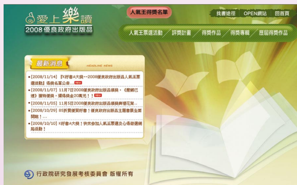
• 2008優良政府出版品網站 http://goodbooks.nat.gov.tw