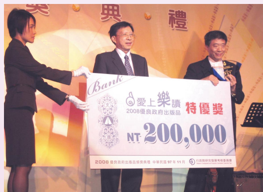
▲ 97年11月5日，行政院長劉兆玄頒發特優獎予《鏗鏘已遠》。

本次得獎名單經簽奉行政院核定後，訂於97年11月5日假中山堂光復廳公開頒獎表揚。其中行政院文建會的《鏗鏘已遠：臺機公司獨特的一百年》，評獎委員徐木蘭女士認為，該書從文化資產調查研究中，運用豐富的文字與圖片，發掘出蘊藏在臺灣產業資產的文化價值，並呈現傳統產業與政策的變遷，因此獲得7位評獎委員的一致認可，從眾多作品中脫穎而出，獨得特優獎及新臺幣20萬元獎金，另行政院衛生署國民健康局的口腔癌防治宣導影片《遺失的微笑》、臺南縣政府長期資助出版的重