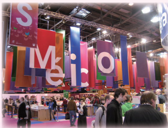
· 2009巴黎書展墨西哥主題館會場。