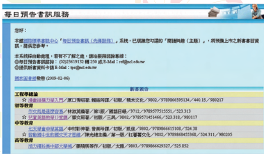
· 收到「每日預告書訊」之e-mail範例