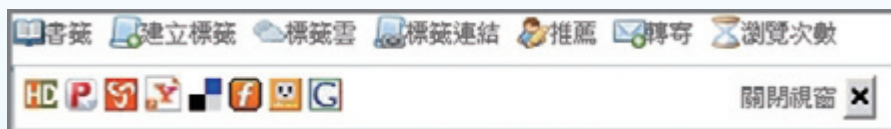
· 圖一、網路書籤服務圖示