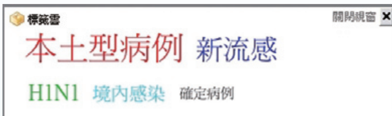
· 圖四、標籤雲服務圖示

四、 轉寄與收藏服務 ：使用者瀏覽網頁後，除了可以透過此項服務，將感興趣的資料以轉寄的方式收藏到個人的電子郵件信箱之外，亦可將值得推薦的數位資訊透過電子郵件分享給其他的使用者，藉此促進資訊傳播之效益與網路社群之互動。