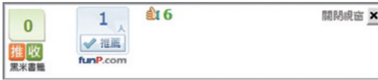
· 圖二、推薦服務圖示

三、 建立標籤 (tag)、標籤雲與標籤連結服務 ：使用者可透過此一機制為其所感興趣的數位內容賦予一個或多個的分類標籤，亦可透過「標籤連結」瀏覽所有被賦予相同分類標籤的資料或被關注的議題。如果點選「標籤雲」的顯示模式，除了可以顯示全體使用者對該筆資料所建立的分類標籤或關鍵字詞之外，亦可透過標籤字體大小與顏色的變化，分享其他使用者對該筆資料的觀點，以及這些觀點被關注的程度。