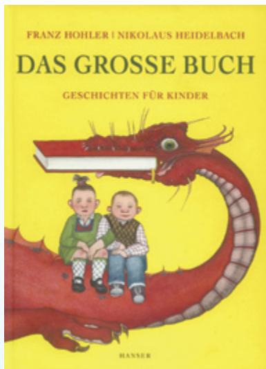
· 《一本大書》（ Das grosse Buch: Gesshichten für Kinder ）

瑞士著名青少年兒童文學作家侯樂（Franz Hohler），2009最新作品《一本大書》（ Das grosse Buch: Gesshichten für Kinder ）集了他多年來寫作短故事的精華，共收錄了90個故事，其中所涉及的主題包羅萬象，包括環保議題、反戰主旨以及許多對日常生活習慣的省思與批評。然而，這些主題嚴肅的故事，讀起來好玩極了，因為說書人侯樂用了「充滿想像力」的情節和幽默的語言風格，陳述他所能傳達給小朋友的理念，異於說教式的寓言，侯樂的寓言故事充滿省思與樂趣，是極為「可口的良藥」，他被德國中學德文教材所選錄的著名故事：〈推銷員和麋鹿〉（ Der Verkläufer und der Elch ），便是環保意識極強烈的作品。