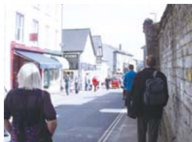
· Hay-on-Wye街景，隨處都是二手書店。