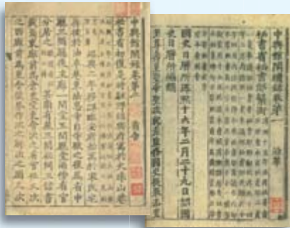
· 《中興館閣錄》 · 《中興館閣續錄》

《中興館閣錄》原10卷，係南宋淳熙4年（1177）秘書監陳騭及同僚仿照南宋初秘書省秘書少監程俱專記北宋秘書省與所管轄三館秘閣的《麟臺故事》，撰集南宋高宗建炎（1127）以來相關記載而成。書凡分沿革、省舍、儲藏、修纂、撰述、故實、官聯、廩祿、職掌九門。《續錄》亦10卷，則係嘉定3年館閣重行編次，後人次第補錄，迄於咸淳，一仿前錄門類；各卷多墨釘，卷十且僅二葉；此外，諸卷又無尾題，大抵是為便於他日增益。案：宋初中央政府藏書，沿襲唐、五代舊制，仍由秘書省掌管，以昭文館、集賢院、史館合稱「三館」，作為實際藏書處所。太宗時，為三館新建館舍，賜名「崇文院」，後又闢特藏書庫，稱「秘閣」。