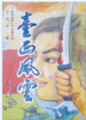
· 丁仔子（丁學經），1982，《臺西風雲》，嘉義：甘地。