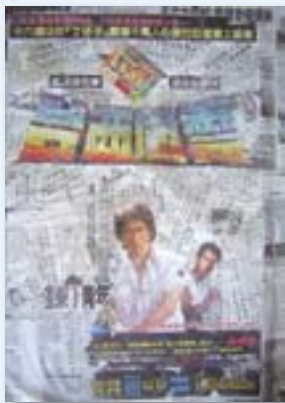
· 1983年丁耀林執導《臺西風雲》電影海報。

宛如時間迴圈（Loop）般，有些歷史彷彿無可避免每每指向某種共同纏繞的抉擇困境。