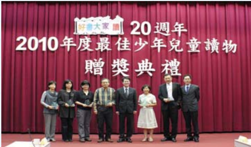
· 2010「好書大家讀」贈獎典禮