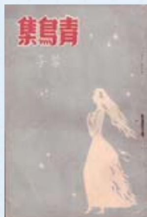
· 《青鳥集》（詩集）/ 蓉子著/1953/中興文學出版社 封面設計：潘壘。（圖片提供/陳文發）

值此倡議東西方兩大繪畫傳統融會貫通的「五月畫會」創始者劉國松，甫替二十二歲的青年詩人杜國清手繪設計了他生平第一部詩歌作品《蛙鳴集》封面，據聞當年劉氏開創「現代水墨」融入大色塊平塗以及揉拓剪貼等表現手法，即是受到民間手抄