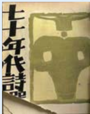
·《七十年代詩選》（詩集）/張默、痲弦主編/1967/大業書店。