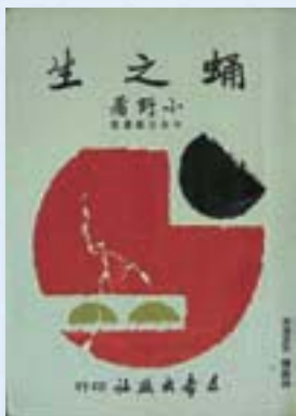
· 《蛹之生》（小說）/小野 著/1975/文豪出版社/封面 題字：李琳/封面設計：陳庭 詩：版畫「日與夜」。

彼時現代藝術革命激情正欲燎起星星之火，卻駭然躊躇於白色恐怖的政治苦悶，以及社會氣氛的黯淡虛無。當年這些被時代壓抑囚禁的年輕心靈可謂「希望與幻滅俱存」、「理想與頹廢共舞」。他們雖想要追求自由的滋味，卻看不到未來，因此，唯有在荒蕪之中遁入地面下的幽閉空間，在這兒默默地進行燃燒青春的儀式，猶如蛹殼幼蟲在隱密處暗自成長，靜候著羽化破土而出。