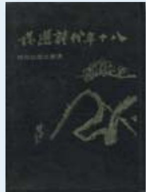
· 《八十年代詩選》(詩集)/紀弦、張默等編/1976/濂美出版社/封面設計:楚戈。