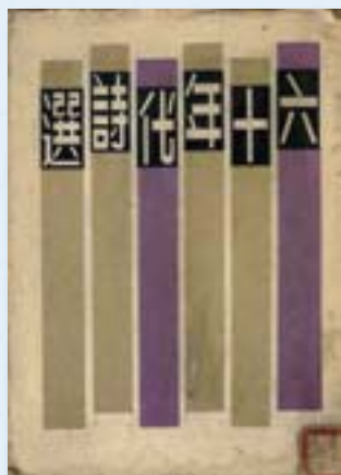
·《六十年代詩選》（詩集）/張默、痲弦主編/1961/大業書店。