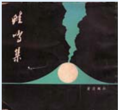
·《蛙鳴集》（詩集）/杜國清著/1963/現代文學雜誌社/封面設計：劉國松。

紙有著不固定纖維紋路的靈感所啓發，而今觀諸劉氏筆下《蛙鳴集》封面形象不啻顯見其注重畫面構成的抽象趣味，以及嫺熟運用純粹形色造型的大膽與透徹。