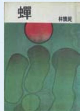
· 《蟬》（小說）/林懷民著 /1974/大地出版社/封面設 計：李錫奇。

於是乎，一干畫家、詩人們紛紛來到這處防空洞裡自由討論、集會和創作，藉以躲避白色恐怖的「偷襲轟炸」，每年聖誕節甚至還開