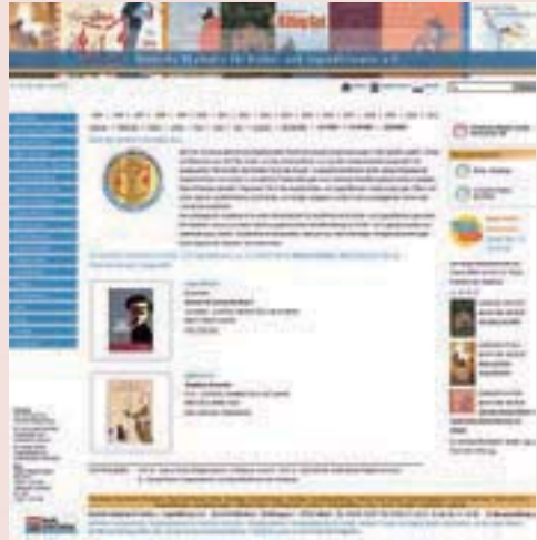
· 「德國兒童與青少年文學學院」與「每月好書」網頁

該網站上提供相關書訊、與主辦單位資訊及其連結網址，方便讀者透過網網相連，取得更多所需資料。該學院「每月好書」活動網址為 http://www.akademie-kjl.de/buch_des_monats.html 。