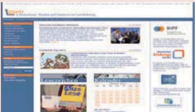
· 「閱讀在德國」網站首頁

目前，Lesen in Deutschland的出版單位爲德國國際教育促進研究院（das Deutsche Institut für Internationale Pädagogische Forschung，簡稱 DIPP），其網站收錄資料編輯與彙整工作，則來自德國教育服務網站及其所屬創新入口網的合作建置。