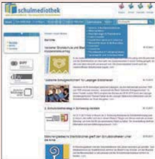
· 「學校媒體圖書館」網站首頁

「學校媒體圖書館」專業入口網，由德國圖書館學會（Deutschen Bibliotheksverbandes）圖書