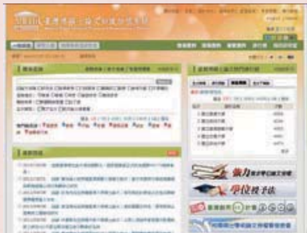
· 臺灣博碩士論文知識加值系統：自由的博碩士論文全文資料庫 ( http://nd1td.ncl.edu.tw )

各校院若與國圖合作，本系統將可為各校院圖書館提供圖書編目、校內機構典藏系統所需之自校論文書目與電子全文檔案，進而大幅節省相關作業所需耗費之時間與人力成本。因此，竭誠歡迎全國各院校加入我們雲端共建共享的行列。