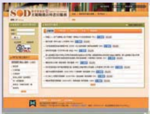
· 主題隨選百科書目服務首頁 ( https://sod.ncl.edu.tw/ )

在書目中心許靜芬主任報告中，從「全國圖書書目資訊網」(NBINet)聯合目錄現況及資料庫架構，說明聯合目錄對於分類號之蒐集、處理、建立索引、提供查詢等運用的考量及作業流程，並敘明佛教類館藏量較多的合作館應用佛教分類法的方式，提出建立分類號與主題詞之關聯等相關建議，期許兩者相輔相成，發揮主題檢索的效益。