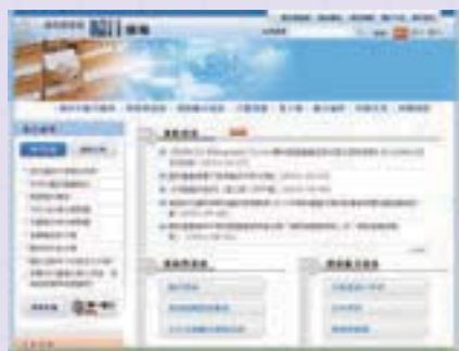
· 國家圖書館—編目園地 ( http://catweb.ncl.edu.tw/ )

曾館長在開幕致詞時指出，完善的分類系統是館藏書籍的整理依據，好的分類法更協助編目館員找到最適合的類號。香光尼眾佛學院圖書館自1996年開始，與本館合作研編《佛教圖書分類法》，當時本館由編目組鄭恆雄主任及江綉瑛股長鼎力