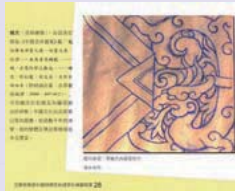
· 《宜蘭曾萬壹彩繪師傅家族建築彩繪圖稿集》頁28局部，可見傳統師傅所繪圖稿及著者簡短說明文字。（經著者同意翻拍刊登）

學習與再造。書所承載與兼負的，在於其對不同年齡層與背景的人，某種存於書的內容以外，純粹又深刻、明顯或幽暗的心靈的觸動，在不同的歲月或時空中，只要人們輕輕翻開書，哪怕只是短暫的一瞥，都可以喚起對每個人來說都是最獨特的啟示或意義。書之於人，有的是潛意識的契合與需求，這種感覺值得一再記憶與回味，並從而衍生出新的意義與內容。