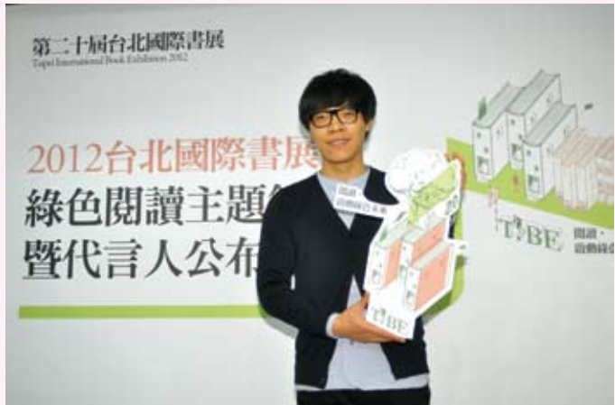
· 盧廣仲代言 2012 臺北國際書展（台北書展基金會提供）。

本屆臺北國際書展邀請到高人氣的獨立音樂歌手盧廣仲擔任代言人，問到他對本次代言的想法，他說：「很開心可以看到不同的書，尤其是來自世界各地的創作都會匯集到書展，我覺得很棒，有這個可以認識不同書籍的機會，感受不同文化的特色。」就像他的創作總是即性不受拘束，他喜歡的書也沒有特定的類型，只要書的文字風格與詞彙排列很順暢，能夠在閱讀之際便感受到作者想表達的故事就會讓他很喜歡。他說，「閱讀沒有界限。」