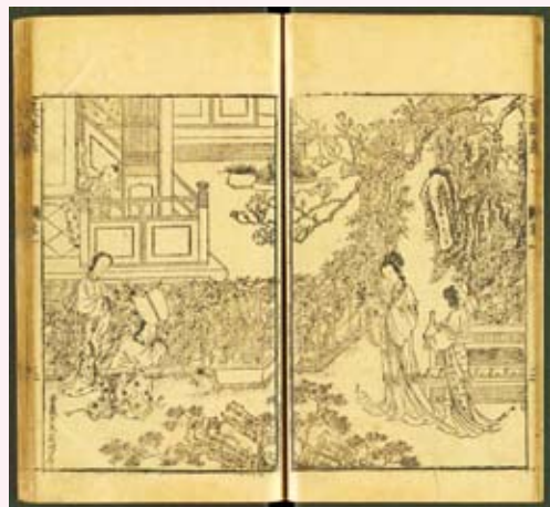
·《吳騷集》明武林張琦校刊本。