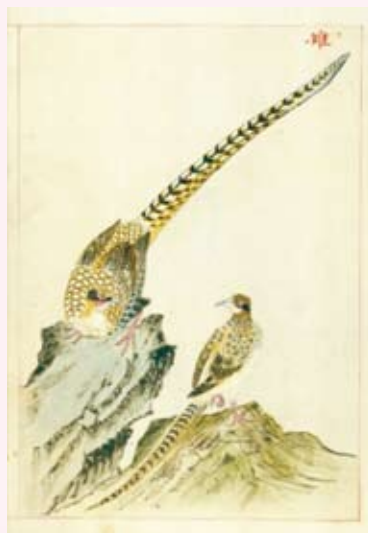
· 《金石昆蟲草木狀》明萬曆四十五年（1617）至四十八年（1620）彩繪底稿。

最後，爲了賦予古籍新生命，近年在教育部「閱讀植根計畫」與國科會「數位典藏與數位學習國家型科技計畫」的支持下，本館除進行大規模古籍數位化計畫，此外自 2005 年開始陸續與美國國會圖書館（Library of Congress, U.S.A.）、美國華盛頓大學（University of Washington）、美國柏克萊加州大學東亞圖書館（East Asian Library, University of California, Berkeley）進行古籍數位化合作，讓更多海外珍籍能夠爲全民所使用，提高臺灣學術研究資源與文化創意知識基礎，同時服務到更多跨年齡層的讀者，讓讀者、研究者更方便地欣賞古人智慧結晶，近而讓古籍產生新的價值與意義，也讓民眾享有更加豐富的閱讀資源。本次活動也將提供民眾透過數位閱讀的方式，即時飽覽明代人物的優游生活。相關內容將同步在本館網站登載介紹。