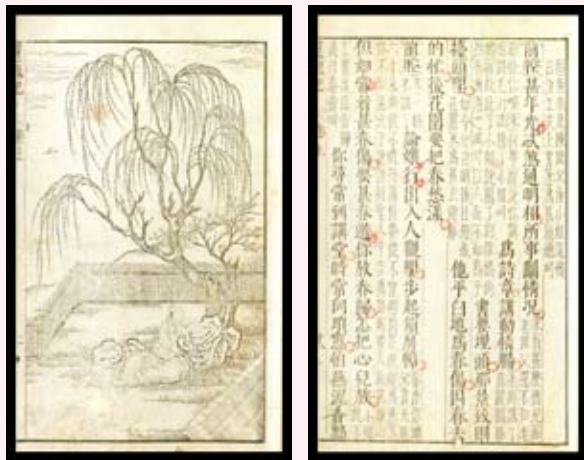
·《牡丹亭還魂記》明萬曆丁巳（1617）刊本。

在養生意境方面：想了解古人慢活態度，以及恬適究竟如何在生活中實踐，明代戲曲家高濂《雅尚齋遵生八牋》，決不能錯過。本書強調尊生、保生、攝生、養生，倡議生命之可貴，在於日常生活中的四時調攝，可彰顯明人的休閒生活。另外，明代的食療家韓奕，以「易牙遺意」為名，撰寫當時的食譜。全書分 12 類，記載 150 多種調料、飲料、糕餅、麵點、菜餚、蜜餞和食藥的制作方法，遙想昔日大師的烹煮美食丰采，頗有明版阿基師的味道。