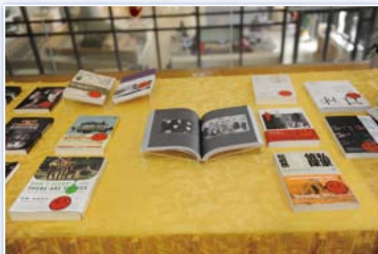
· 1月7日在國圖舉行的2011開卷好書獎贈獎典禮，會場展示得獎好書。

到了「2011 開卷好書獎」，我們得到更多的助力，其中非常重要的助力來自國家圖書館。國圖的協助不僅是分擔經費而已，而是真正做到了夥伴關係，除了將開卷好書獎的 BV 收入國圖典藏系統，在合作過程中，國圖同仁更讓我見識到「服務」這二字的價值，他們尊重開卷的各種構想，讓我們的構想完美呈現，服務二字說起來容易，但因為它不居功，很難讓人看見，尤見其是一種珍貴的美德。謝謝國圖同仁的付出。