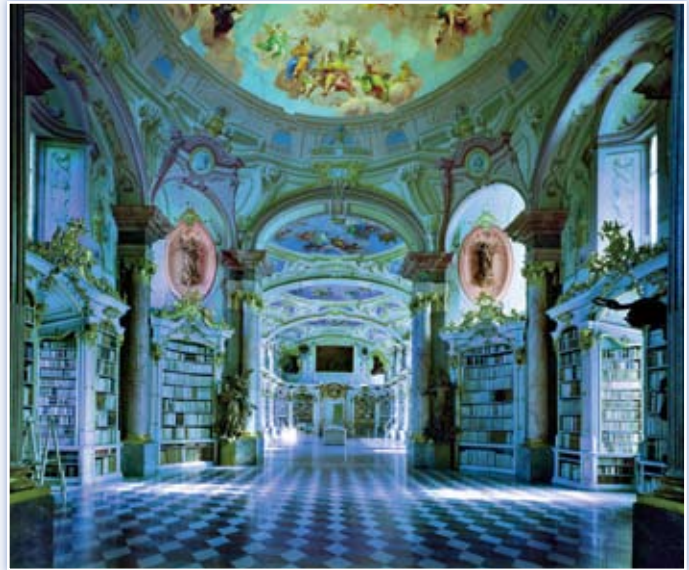
· 奧地利艾德蒙特圖書館（Admont Library, ）

典藏的稀有性，亦是此次出現在展出作品中的圖書館的特色之一。例如布拉格 Strahov 圖書館最珍貴的古籍之一是 9 世紀具備羅馬式、哥德式裝飾的禱告禮拜書（Strahov Evangeliary），佛羅倫斯 Marucelliana 圖書館則典藏了 Francesco Redi 與 Giacinto Cestoni 的親筆簽名的文件以及 Antonio Vallisner 所留下的信件，愛爾蘭都柏林聖三一學院圖書館典藏了舉世聞名的凱爾經（ Book