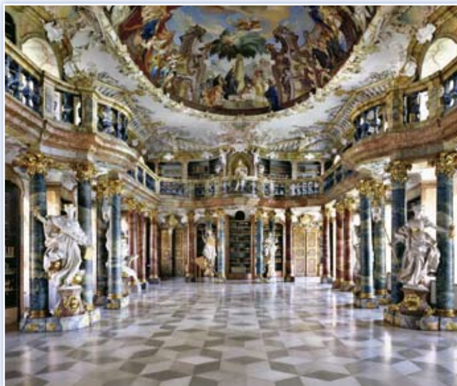
· 德國維布林根圖書館。(Wiblingen Library, Massimo Listri 攝影)

世界圖書館攝影展 2 月 2 日開幕，一場揭示圖書館帶給人類許多層面巨大影響的展覽，將隨著國家圖書館曾淑賢館長於開幕典禮致詞時所指出的圖書館的精神而開始：「圖書館是人類文明的寶庫，也是反映一個國家或地區綜合實力和文化水平的標誌。無論是古代，還是現代，人們總是把書看做是精神的東西，而把存放書的建築看做是精神的殿堂加以點綴和美化。幾千年來，不管圖書館的性質和功能發生了多麼大的變化，絲毫都沒有影響建築設計師對圖書館外部形象的看法：圖書館應該是一個標誌性的文化建設。古代的藏書樓也好，現代的圖書館也好，就如一部部永恆的作品，刻寫著不同時代不同地區的文明軌跡」。