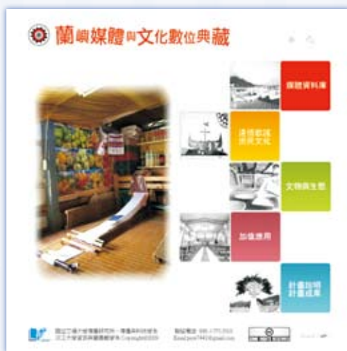
圖 1 「蘭嶼媒體與文化數位典藏」首頁 ( http://lanyu.nctu.edu.tw )

自民國 94 年 3 月起，由國立交通大學傳播研究所、傳播與科技學系與淡江大學資訊與圖書館學系共同組成的團隊，以蘭嶼為主題申請「數位典藏國家型科技計畫」公開徵選計畫，至今共執行「蘭嶼原住民媒體資料庫數位典藏計畫」、「蘭嶼原住民媒體與文化數位典藏計畫」、「蘭嶼原住民媒體與文化數位典藏加值應用計畫」及「蘭嶼文物與生態影像數位典藏計畫」等四項計畫。這些計畫以數位化機制保存屬於蘭嶼原住民（達悟 / 雅美族）的各項資料，特別是由蘭嶼當地族人所產製或創造的資料，同時依據使用者需求選取適當的數位內容進行有系統整理，並利用既有軟體工具來開發各項加值應用服務，藉由網路（網站）平台傳播給使用者。為整合這些計畫成果，並提供更為便利的使用管道，此計畫團隊特建置「蘭嶼媒體與文化數位典藏」網站（見