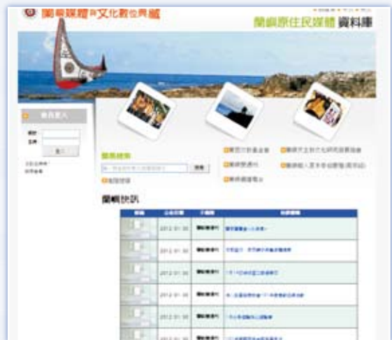
圖 2 「蘭嶼原住民媒體資料庫」首頁 ( http://lanyu.nctu.edu.tw/database/lanyu/index/index.aspx )

在執行期間，除完成上述各項媒體資料的數位化工作外，亦建置「蘭嶼原住民媒體資料庫」（見圖 2）做為資訊傳播機制。由於計畫團隊長期投入蘭嶼的數位典藏工作，於第 2 年開始陸續獲得當地文史工作者或機構，如朗島部落天主教文化發展協會謝永泉先生、漁人部落董森永牧師、夏曼賈巴度、希嫻紗吞燕、東清部落張海嶼牧師、椰油部落蕭玉霜小姐和王桂清先生、紅頭部落周宗經（夏本奇伯愛雅）先生、周朝結先生等人提供各項媒體資料，如書籍、幻燈片、錄影帶、通訊期刊、畫作、日記、文物等，讓「蘭嶼原住民媒體資料庫」的收錄範圍不僅於蘭恩文教基金會的媒體資料，更擴及蘭嶼當地其他人士所產製或收集的各項資料，使得該資料庫更能夠體現蘭嶼原住民媒體內涵，也更能完整呈現蘭嶼當地對其文化保存的努力。該資料庫至今已建置 13,000 多筆 metadata，資料類型包括圖書、單篇文獻（期刊文章、報紙或通訊報導）、傳統照片、幻燈片、畫作、聲音、文物、DV、VHS、Hi8 等。