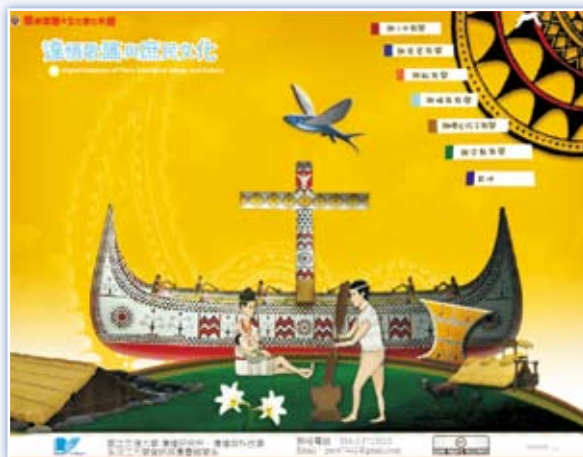
圖3 「達悟歌謠與庶民文化」網站 ( http://lanyu.nctu.edu.tw/songs/ )

該計畫以達悟（雅美）歌謠為主，以庶民文化為輔進行數位典藏工作，建置「達悟歌謠與庶民文化」網站（見圖3），提供7類（小米、捕魚、船、房屋、婦女孩子、宗教、其他）主題，共173首歌謠內容。在每一主題下有主題說明、照片資料、文獻資料和影音資料等。在影音資料部分則提供每首歌謠的歌詞（達悟語拼音及漢語釋意）、歌謠說明（文字說明及解說聲音）與影音播放（歌謠聲音和部分影片）。而庶民文化部分，則是以當地紅頭部落的天主堂壁畫與蘭嶼天主教文化研究發展協會發行的《飛文季刊》的線上瀏覽為主。