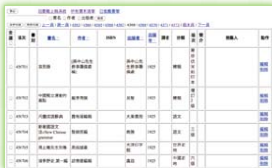
· 上稿系統搜尋畫面。

每一次面對面會議，幾乎都是超過四個鐘頭，甚至超過十個鐘頭以上。雖然我們設計的雲端選書系統，讓每一次委員票選的意見，都能立即呈現，但由於資料量實在很大（剔除重複的