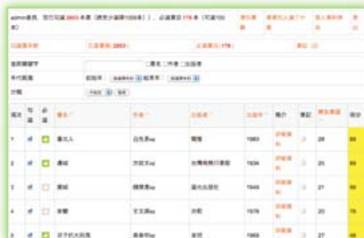
· 委員選書系統畫面。