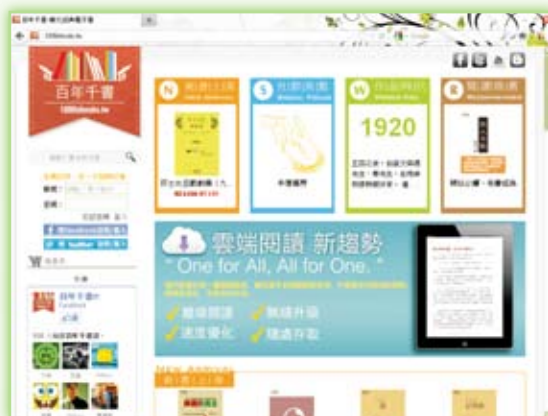
· 百年千書網站 (1000ebooks.tw)

一年多前，從詹宏志先生的筆記本上，用手機拍下他寫的委員名單開始，百年千書工作小組無盡的忙碌就此開始。計畫至今並未隨著百年千書網站（1000ebooks.tw）的正式上線而停歇，反而因為來自網友的需求，特別是海外的朋友，更需要加快腳步，提供更多電子書，實現更多該做的事情。