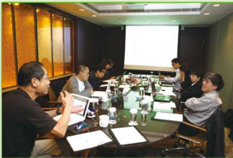
· 百年千書選書會議，評審一邊選書一邊說書。