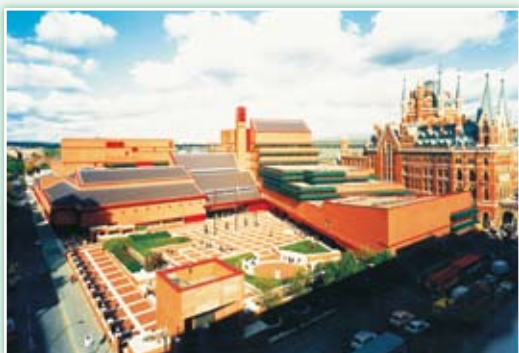
· 大英國書館全景。