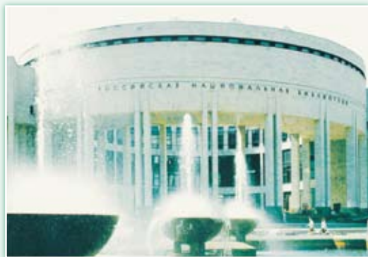
· 俄羅斯國家圖書館 (The National Library of Russia)。

《世界圖書館紀行》收錄了埃及、英、義、德、法、俄、美、中國、日、北韓、韓國等 11 國 32 個圖書館；廣智文化公司增補了我國國家圖書館，使本書更臻完備。因為「在韓國還沒有正式介紹俄羅斯圖書館的相關資料，雖然韓國的圖書館專家們時常訪問美國或西歐的圖書館，但還未仔細地訪問過曾為社會主義國家的圖書館」（頁115），所以本書以較大篇幅（幾近三分之一）介紹俄羅斯圖書館界。雖然我國國家圖書館代表團（一行4人）在2011年8月參訪俄羅斯國家圖書館（National Library of Russia）、俄羅斯科學院圖書館等12個重要圖書館與漢學研究機構，進行贈書、簽署合作協議等各項文化學術交流活動，但是本書介紹該國10個重要圖書館，也將增進瞭解俄羅斯圖書館界真貌。尤其俄國文學的發達在世界上可算數一數二，文學作家可稱全球翹楚，圖書館必有獨到之處。