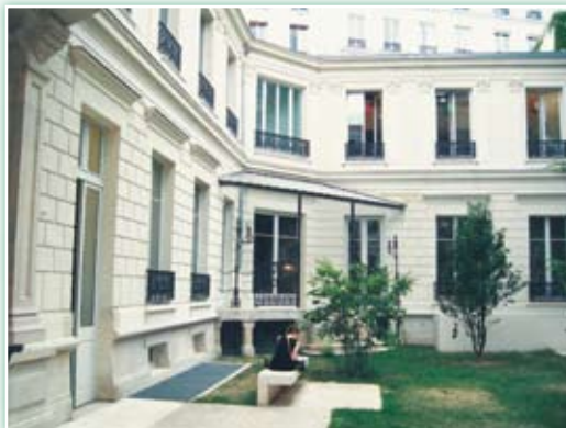
· 法國國家圖書館—黎塞留圖書館內部庭院。

焚書始末；政治、學術、文學與圖書館的關係；國家重要典籍、史料流失國外及追索；哲學家、文學家、政治家等的富哲理的名句；重要人物的介紹；圖書館軼事等，琳瑯滿目，美不勝收。特別是俄羅斯部分，可稱是一部帝俄自彼得大帝以來的圖書館史。本書紀事詳實，又饒富趣味，可讀性極高，使人讀來彷彿超越時空，沉醉在人類所創造的文明裡。