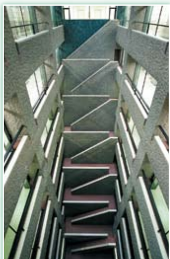
· 日本國會圖書館東京本館的地下八層書庫。

除此之外，本書也披載許多因作者的觀察而挖掘出文獻所未有記載的情事，令人玩味沉思。例如俄羅斯國立圖書館收藏改變人類歷史或對世界有極大影響力的名作第一版，如 1762 年盧梭《愛彌兒》、1859 年達爾文《物種起源》、1862 年雨果《悲慘世界》、1867 年馬克思《資本論》、1869 年托爾斯泰《戰爭與和平》等。伏爾泰逝世後，卡捷琳娜二世（Catherine II）女皇從速由他的遺族手中購得他全部的藏書及與女皇來往的書信；原來是伏爾泰曾說：「我習慣在書本空白處寫下對那本書的想法。」這才是真正瞭解伏爾泰偉大之途徑。據俄羅斯國立圖書館表示，號稱世界最大圖書館的美國國會圖書館位在人口較少的華盛頓，讀者人數並不多；但俄羅斯國立圖書館一天的讀者就超過 4,000 多人，況且該館還擁有很多其他圖書館所沒有的貴重圖書。尤其令人吃驚的是二次大戰期間德軍封鎖聖彼得堡 900 天（1941-1943），當時有 67 萬人被餓死、凍死、被砲彈炸死，即使在零下 30 至 40 度的凜冽寒冬，每扇窗的玻璃都被打破了，暖氣更是早就被切斷了，俄羅斯國立圖書館還是照常開放，真是件令人難以置信的事。節錄本書以上各節，值得我圖書館界在文獻的收集與服務上深思。