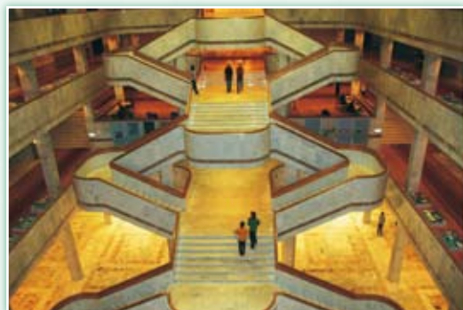
· 俄羅斯國家圖書館新館的中央階梯。