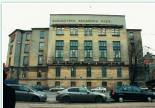
· 俄羅斯科學院圖書館的正門。蘇聯政權瓦解後，移除了橫額上右側「蘇聯 (CCCP)」的字樣。