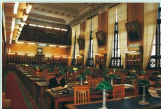
· 俄羅斯科學院圖書館主閱覽室的全景。後方中央掛著沙卡洛夫博士的照片。

其次，本書也紀錄國家圖書館最多。國家圖書館是指由一國政府設置，並具有代表性的圖書館，是一個國家圖書館事業的推動者，常以「圖書館中的圖書館」看待，也是國家建立的負責收集和保存本國出版物，做為國家總書庫功能的圖書館。為了完整保存國家文獻，通常透過出版物「送繳制度」(Legal Deposit System)，規定本國出版物於發行時，均應送繳國家圖書館收存；該館因而據以編製國家總目錄。一般除收藏本國出版物外，還收藏大量外文出版物(包括有關本國的外文書刊)。國家圖書館的類型甚多，最主要的有兩種，一種為公共性的中央圖書館，如法國國家圖書館、大英圖書館等；另一種為國會圖書館兼作國家圖書館，如美國國會圖書館、日本國會圖書館等。由於作者來自國會圖書館，本書記載也不乏議(國)會圖書館。