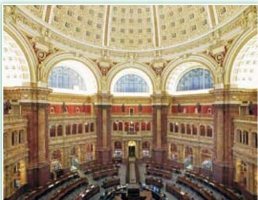
· 美國國會圖書館富麗堂皇的主閱覽室。