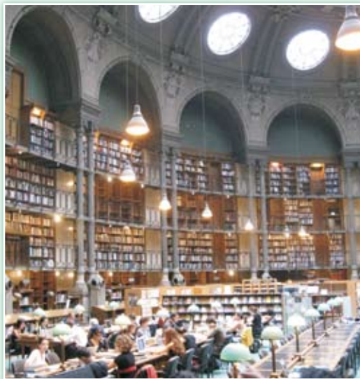
· 法國國家圖書館—黎塞留圖書館閱覽室。