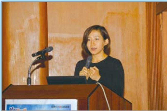
· 首場由郝譽翔教授主講「暴烈與溫柔：談桂花巷中的女性世界」。

講座活動當日儘管碰上博愛特區進行嚴密的交通管制，但絲毫未影響讀者參加的意願，當天國際會議廳內湧入了超過 240 位的來賓，座無虛席，許多讀者克服了交通不便，及時於電影開映前便抵達會場，更有遠從花蓮、新竹、苗栗專程趕來聆賞演講的讀者，展現了對閱讀臺灣文學的熱情洋溢，似也預先昭告後續的六場講座勢必盛況可期。